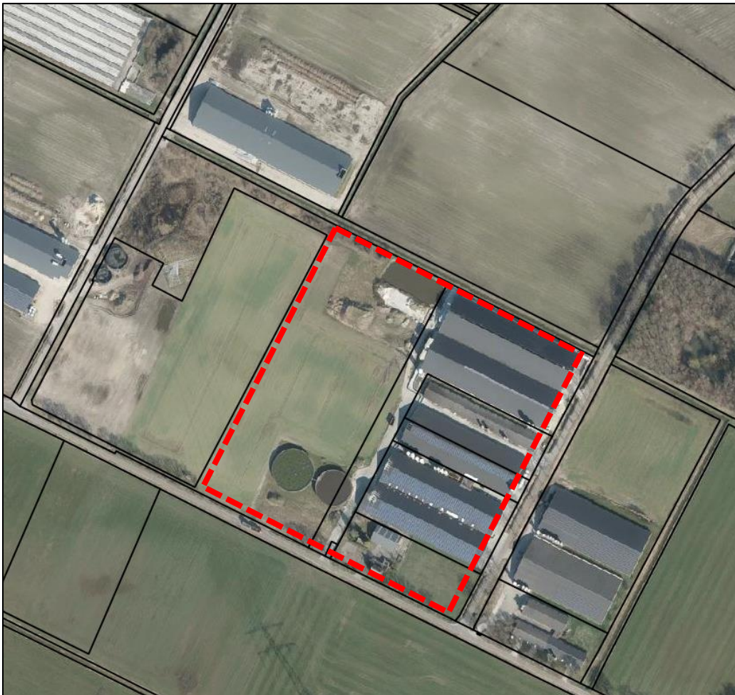
Locatie Rongvenweg 14 (rood omlijnd)

In de aanvraag voor omgevingsvergunning is uitgegaan dat er een maximaal 38.646 m 2 aan daken en verhardingen mogelijk gemaakt wordt. Bij een maximale lozingsnorm van 2 liter per seconde per hectare aan verhardingen mag er daarmee 2.7 m 3 per uur geloosd worden op het oppervlaktewater (in geval van extreme regenval). Hiervoor wordt dan ook bij deze toestemming voor gevraagd.