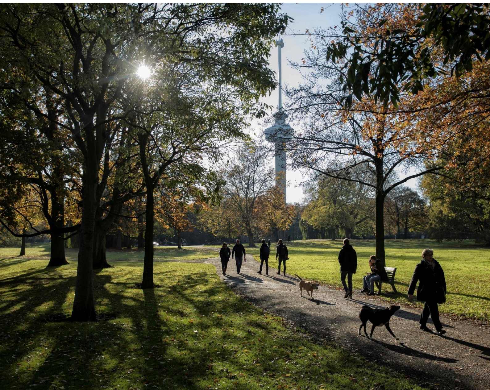
Het Park en de Euromast (beide rijksmonument)