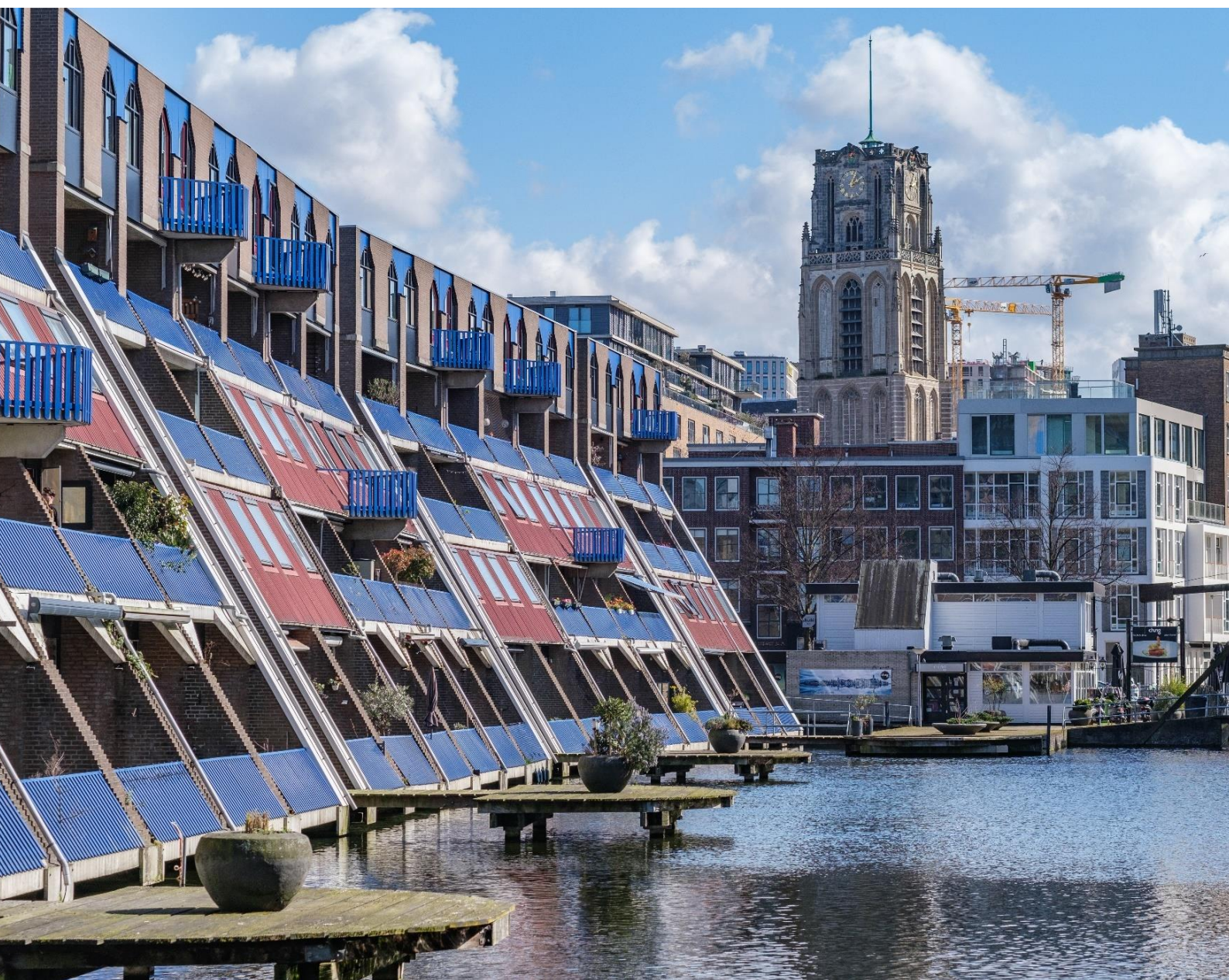
Tijdlagen aan het Haagseveer met op de voorgrond bebouwing uit de jaren 80, daarachter de wederopgebouwde binnenstad met de gedeeltelijk herbouwde Laurenskerk uit de 15 de eeuw (rijksmonument)