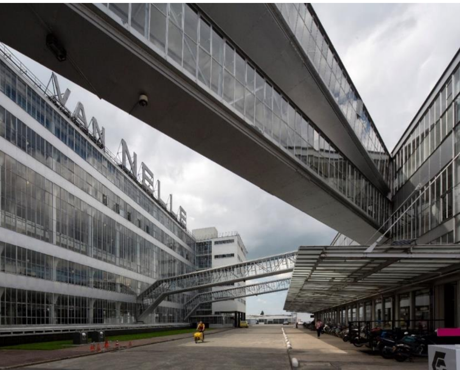
UNESCO Werelderfgoed Van Nellefabriek (UNESCO Werelderfgoed) | Eric Fecken