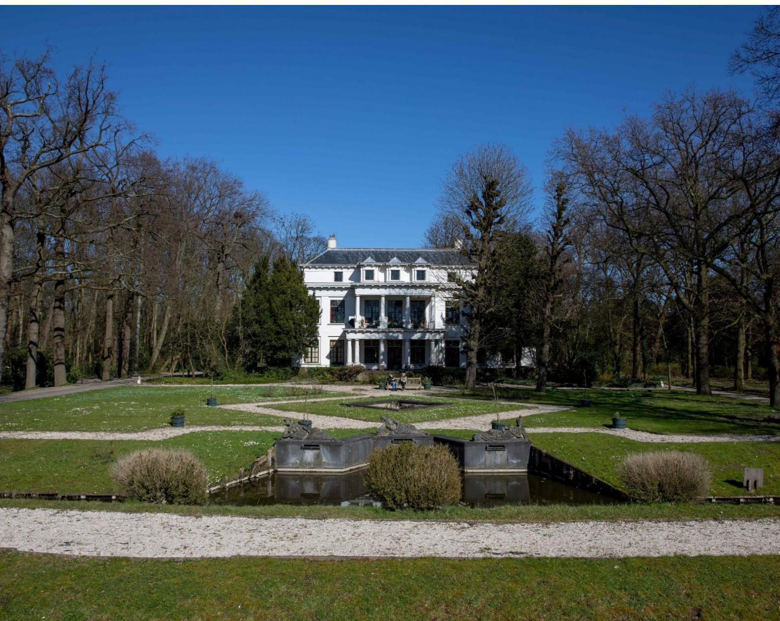
Landgoed De Tempel aan de Delftweg te Overschie (rijksmonument)