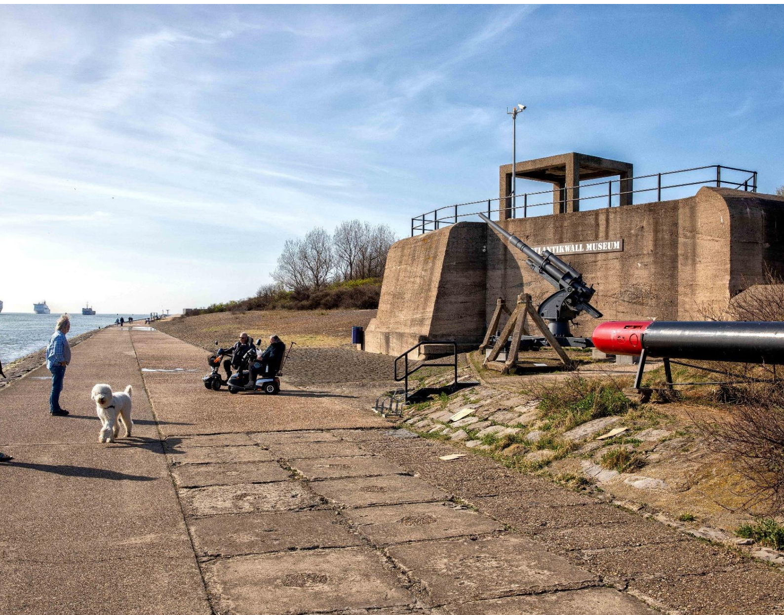
De voormalige stelling Nordmole gelegen in het Voorduin te Hoek van Holland (gemeentelijk monument) | E. Fecken