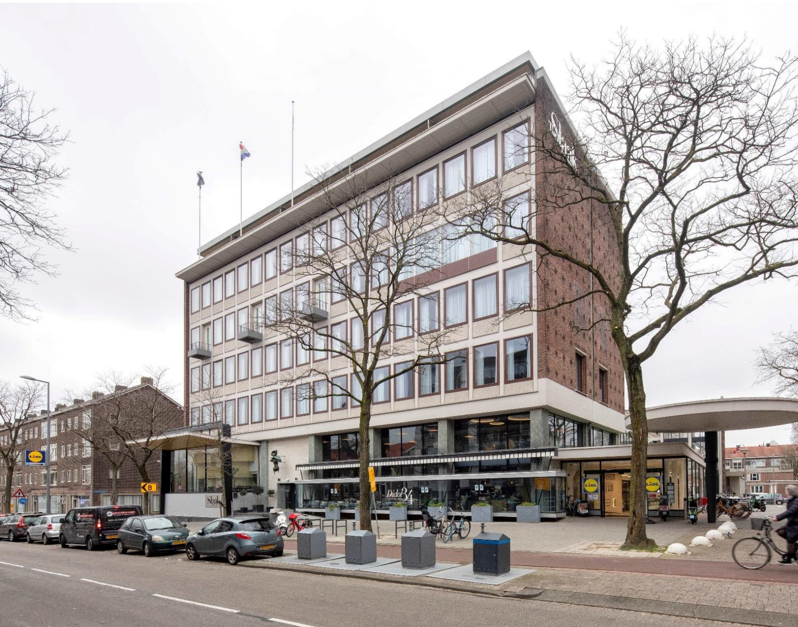
Het Slaakhuis, het voormalige kantoor van dagblad Het Vrije Volk (rijksmonument)