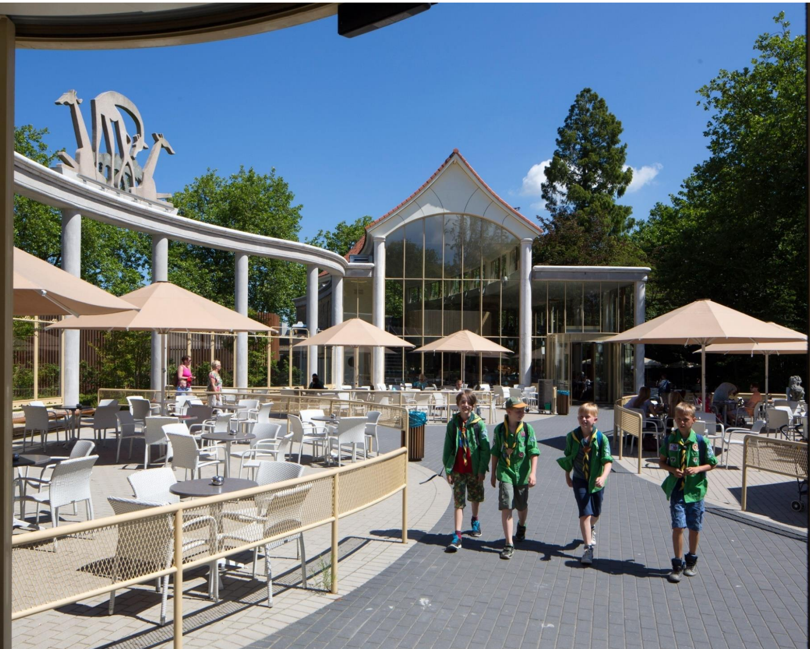
Gerestaureerd giraffenverblijf in het rijkmoment Diergaarde Blijdorp | E. Fecken