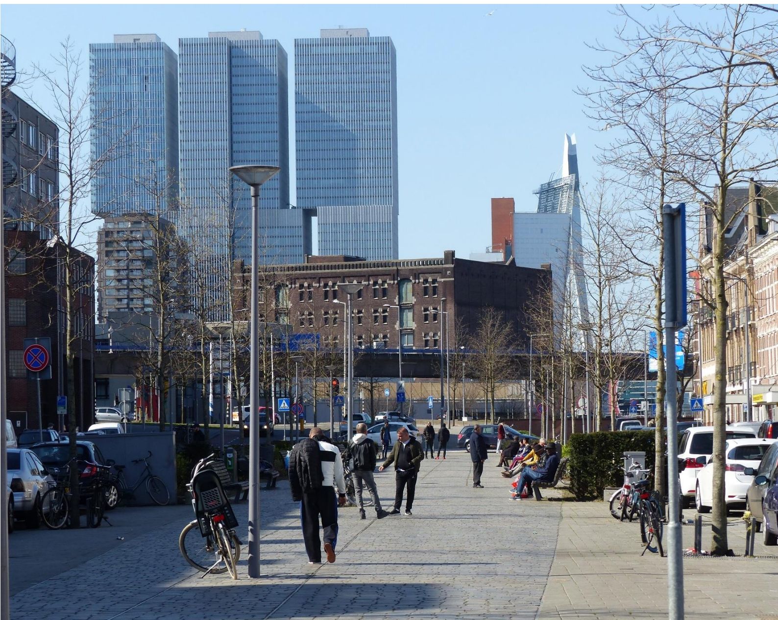
Tijdlagen: De Afrikaanderwijk met 19 de eeuwse bebouwing – rijksmonument Pakhuis Santos – recente bebouwing op de Wilhelminapier | H. Grootenhuijs