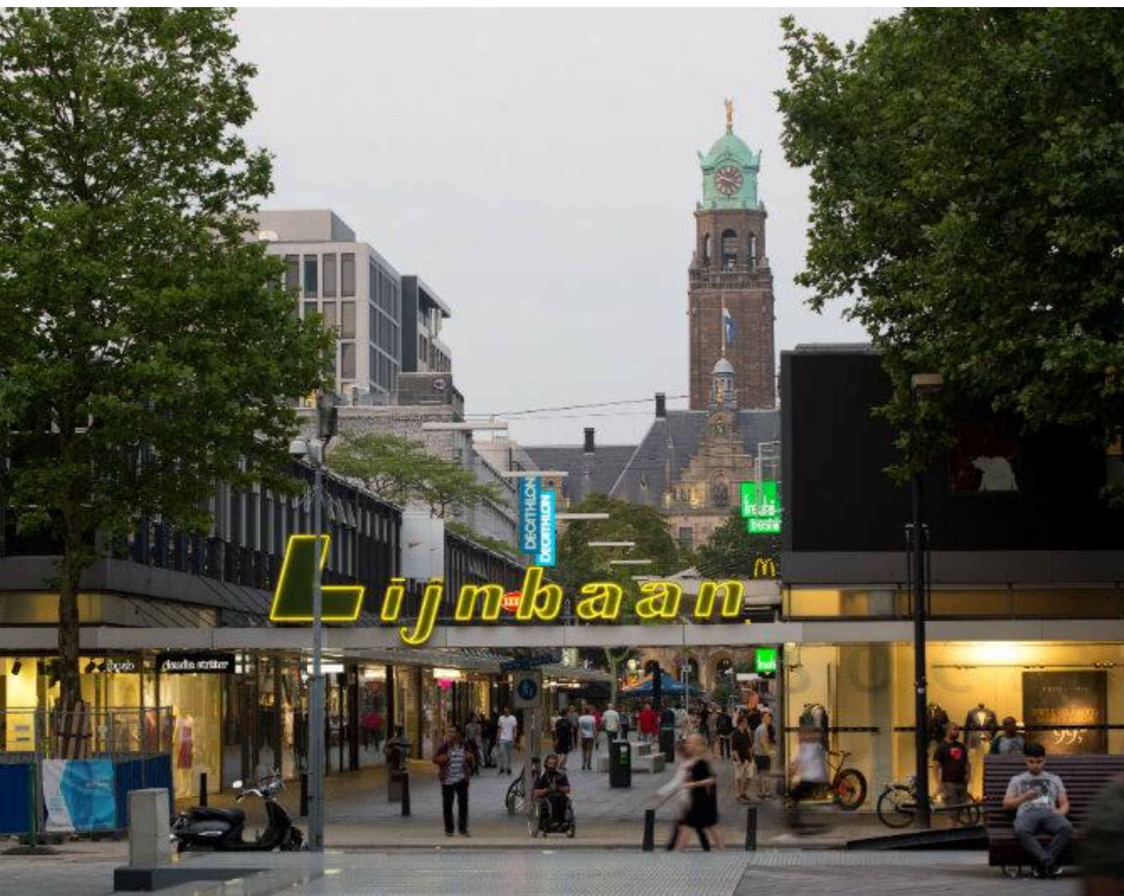
Zichtlijn vanaf de Korte Lijnbaan, onderdeel van het complex Lijnbaan (rijksmonument), op het Stadhuis (rijksmonument) | E. Fecken