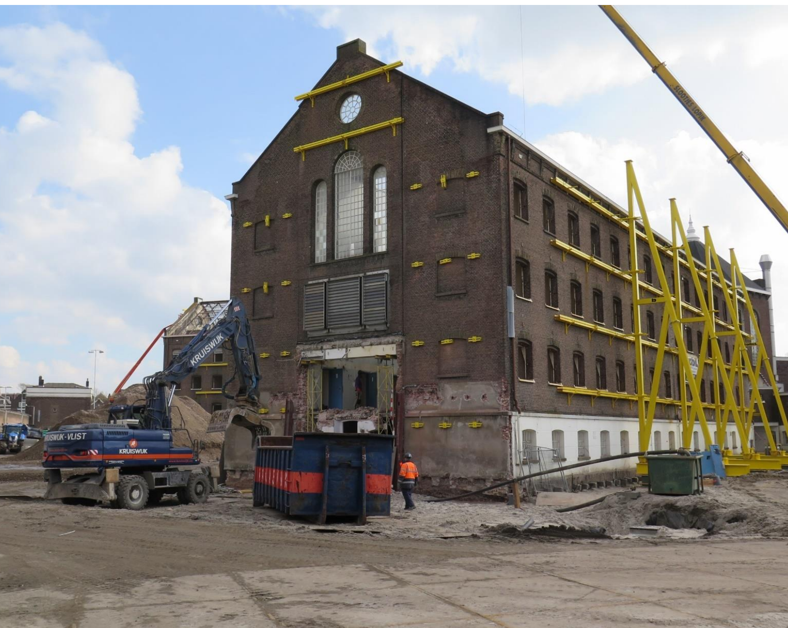
De transformatie van het Huis van Bewaring aan de Noordsingel tot appartementencomplex. Project opgeleverd najaar 2021 | R. Stoute