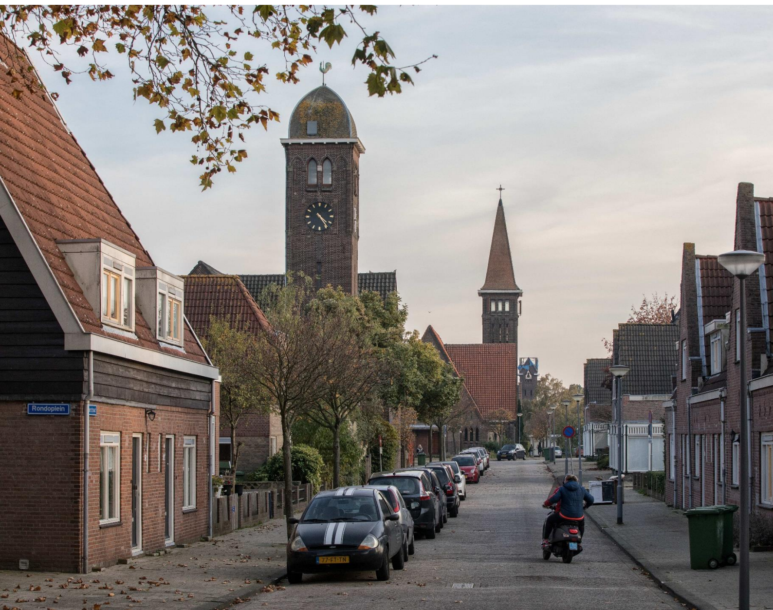
Drie herbestemde kerkgebouwen – aangewezen als gemeentelijk monument - gelegen binnen het rijksbeschermd stadsgezicht Heijplaat | E. Fecken