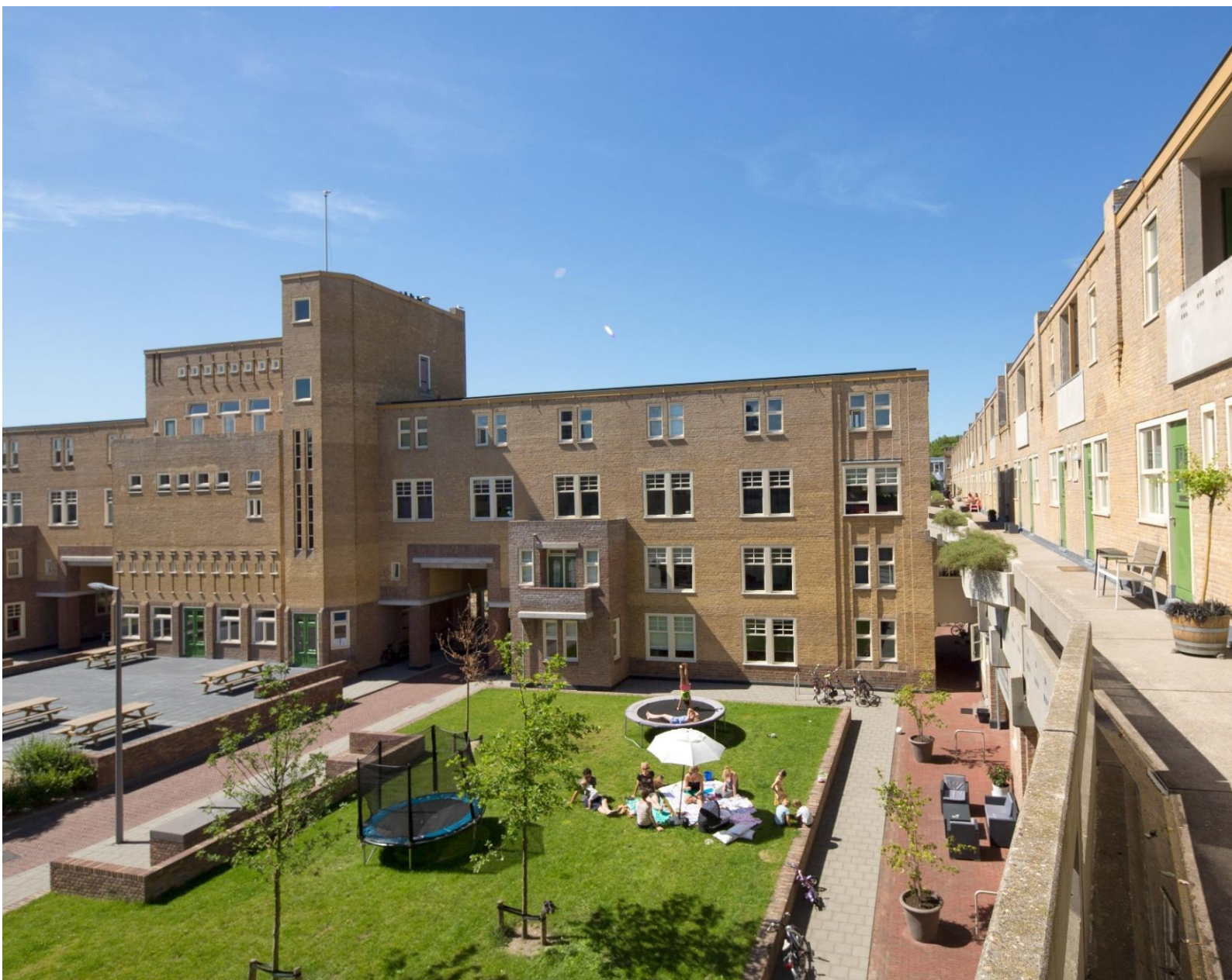
Het Justus van Effencomplex (rijksmonument) | E. Fecken