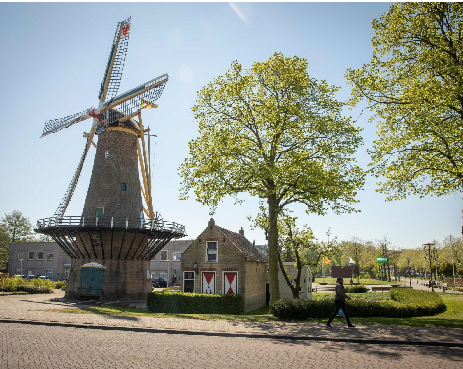
Korenmolen en molenaarswoning De Hoop in Rozenburg (rijksmonument)