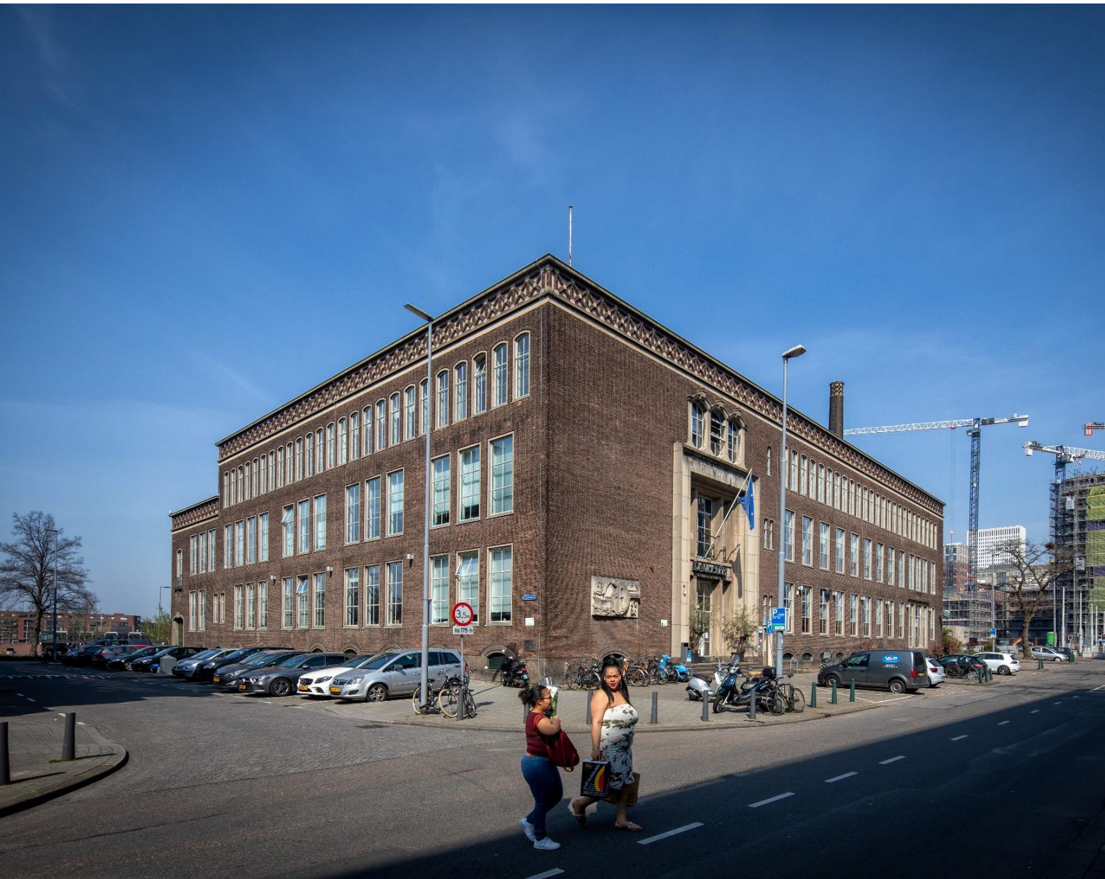
De voormalige Hogere Zeevaartschool aan de Willem Buytewechstraat, beter bekend als De Machinist (gemeentelijk monument) | E. Fecken