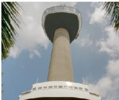
60 JAAR EUROMAST