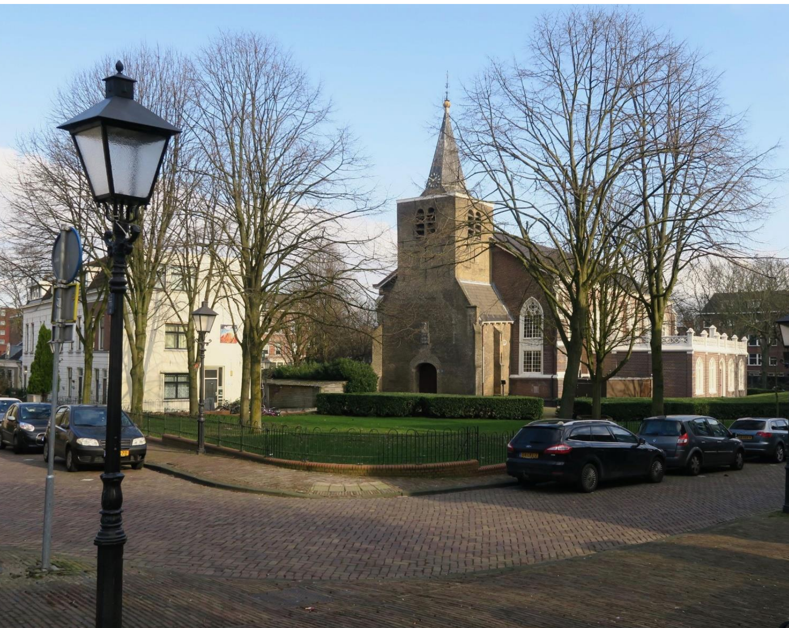
De Oude kerk in Oud-Charlois (rijksmonument) | R. Stoute