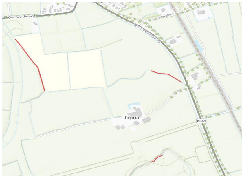
Figuur 1: Locatie van werkzaamheden. De rode lijnen geven te dempen watergangen weer.

Het dagelijks bestuur van het waterschap Noorderzijlvest heeft op 7 april 2023 van een aanvraag ontvangen om een vergunning als bedoeld in hoofdstuk 6 van de Waterwet (Wtw). De aanvraag betreft het dempen van secundaire watergangen en het verbreden van secundaire watergangen ter hoogte van de adressen Winsumerstraatweg 4 en Maarhuizen 1 te Winsum, zoals hieronder globaal is weergegeven in figuren 1 en 2.