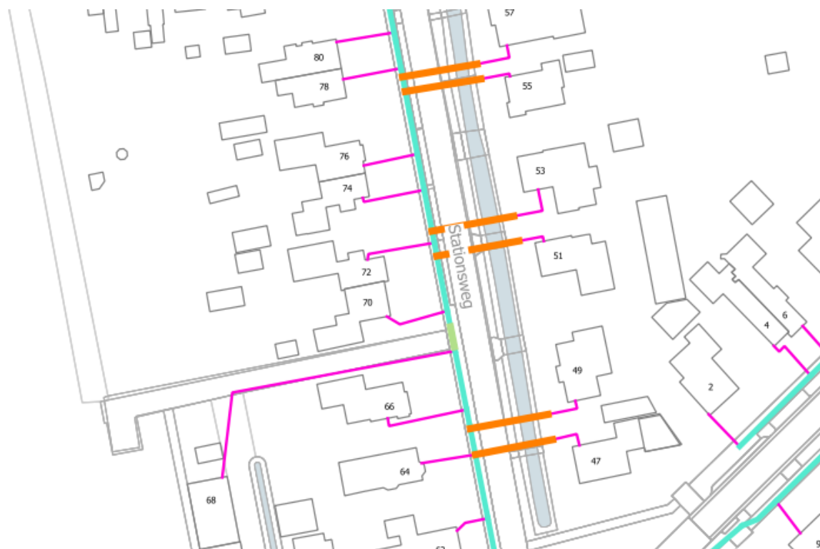
Figuur 3 - Situatietekening locatie gestuurde boringen onder een hoofdwatertang nabij Stationsweg 49 te Bedum (boringen aangegeven met oranje strepen)