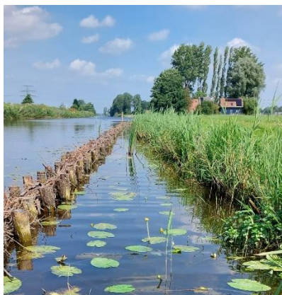
Figuur 1: Voorbeeld natuurvriendelijke oever met vooroeverconstructie