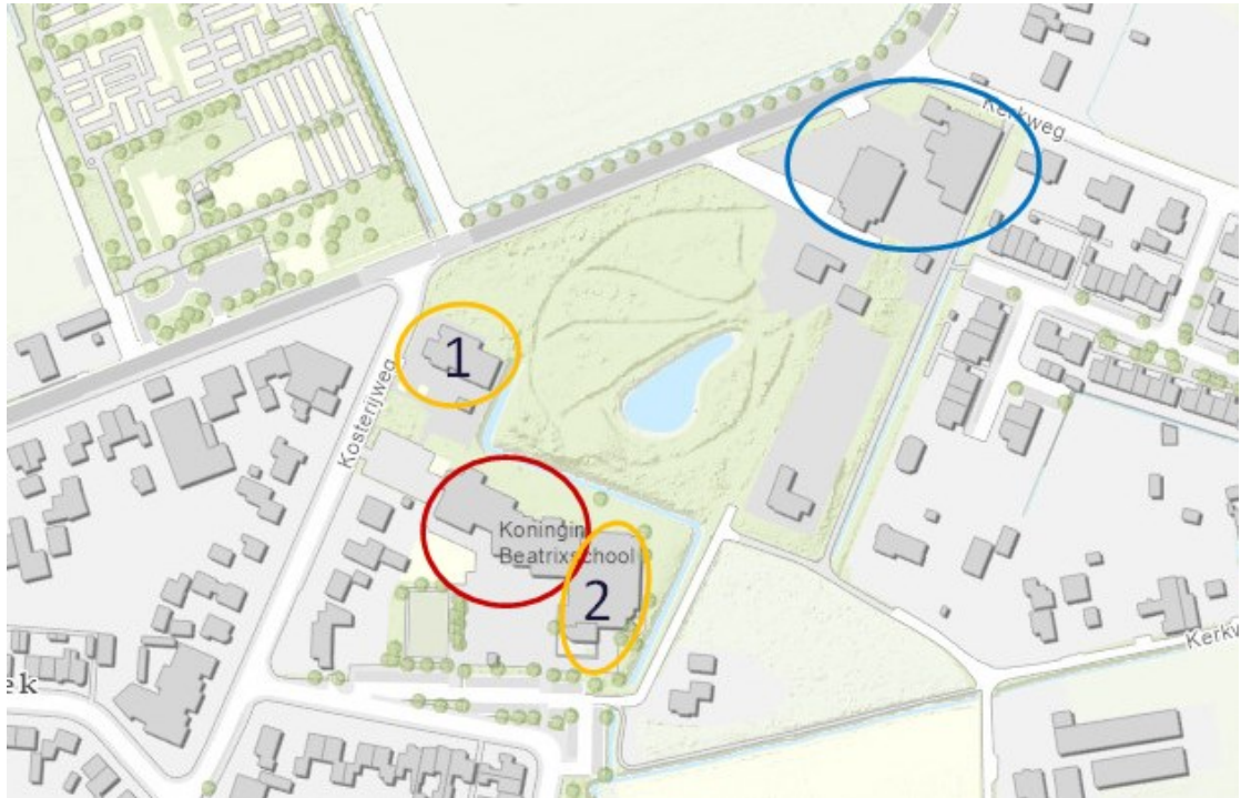
Figuur 1. Locaties mitigerende maatregelen. Oranje = het plangebied, blauw = de locatie van de 12 tijdelijke vleermuiskasten en rood = de locatie van de 12 permanente voorzieningen die reeds gerealiseerd zijn. Er worden nog 8 permanente voorzieningen in de nieuwe sportaccommodatie gerealiseerd. De ecologische deskundige bepaalt de plaatsing van de inmetsekkasten in het gebouw. De plaatsing van de 12 permanente voorzieningen in de Koningin Beatrixschool is opgenomen in een document die separaat bij dit besluit wordt verstuurd (documentnummer 03888951).