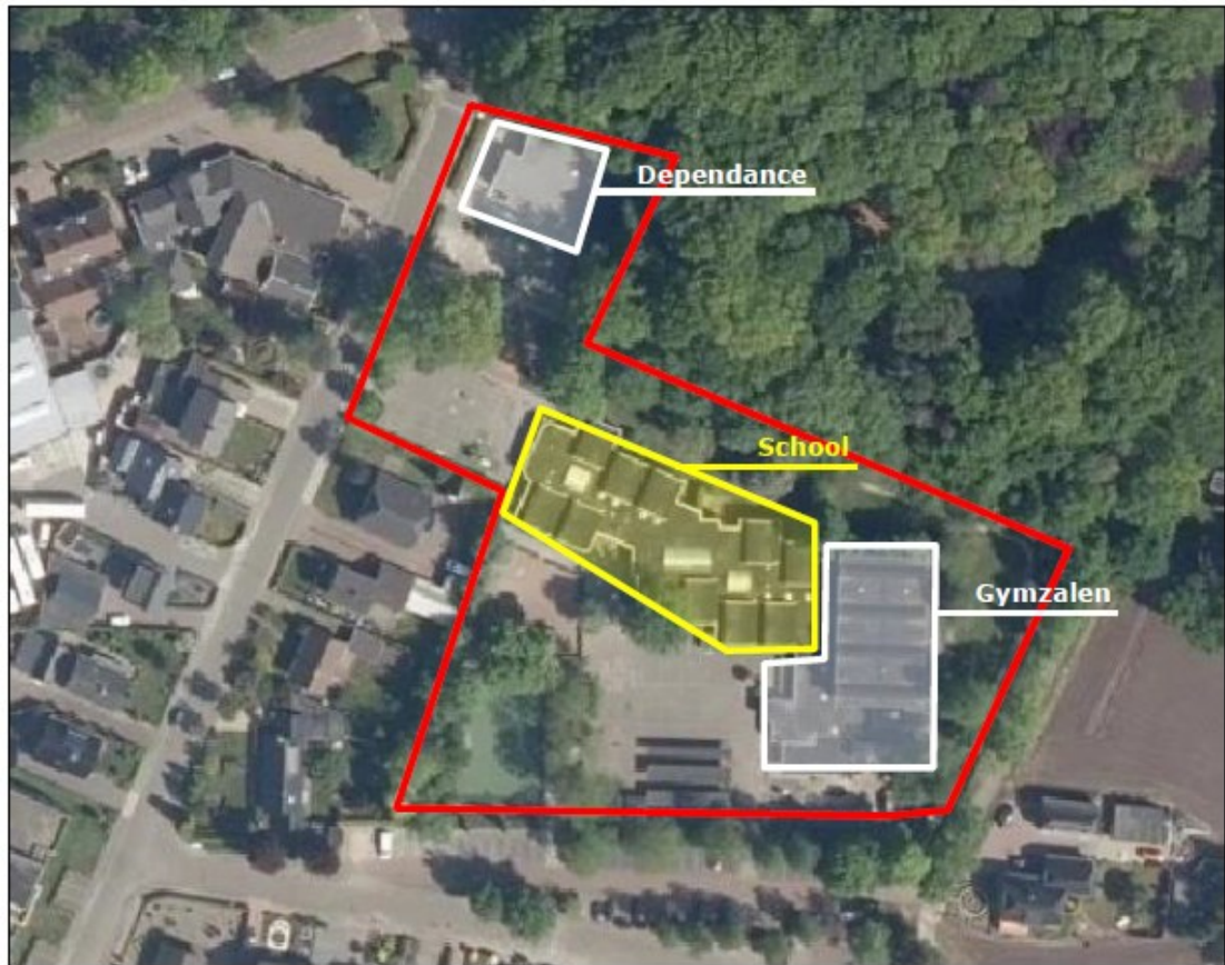
Figuur 2. Overzicht schoolterrein. Het projectgebied wordt gevormd door de gymzaal 'Het Kamphuis' en de dependance 'Het Boshoekje' (witte contouren).