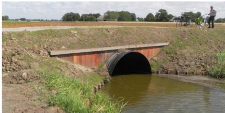
De duikerdam na de sloop van de brug sinds 2014.

De karakteristieke betonbrug van ergens beging vorige eeuw verbond de oevers, gaf doorgang aan toen voornamelijk transport landbouwproducten over water en werd ook gebruikt als laad plek van landbouwproducten (denk aan bieten) op schuiten. Daarvoor dienden de gaten in de leuning en er zouden ook luiken in het brugdek geweest zijn.