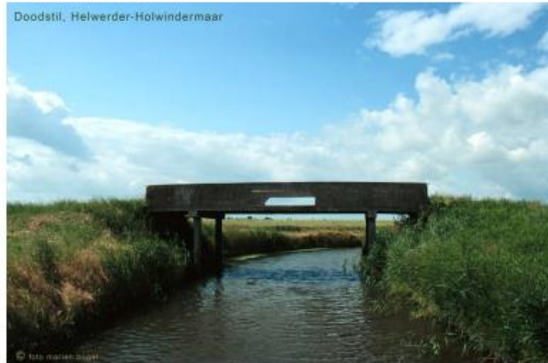
Archieffoto van de brug over het Helwerdermaar , Barmerheerd – Holwinde.

De karakteristieke betonbrug van ergens beging vorige eeuw verbond de oevers, gaf doorgang aan toen voornamelijk transport landbouwproducten over water en werd ook gebruikt als laad plek van landbouwproducten (denk aan bieten) op schuiten. Daarvoor dienden de gaten in de leuning en er zouden ook luiken in het brugdek geweest zijn.