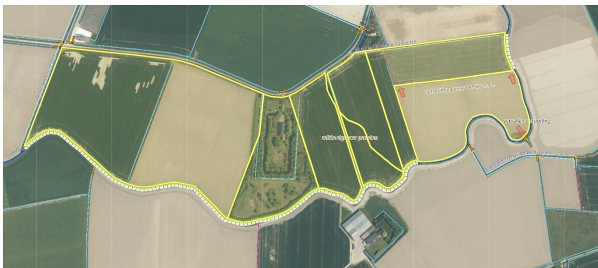
Afbeelding 1.7.1 ontsluiting perceel KTS00-L-91