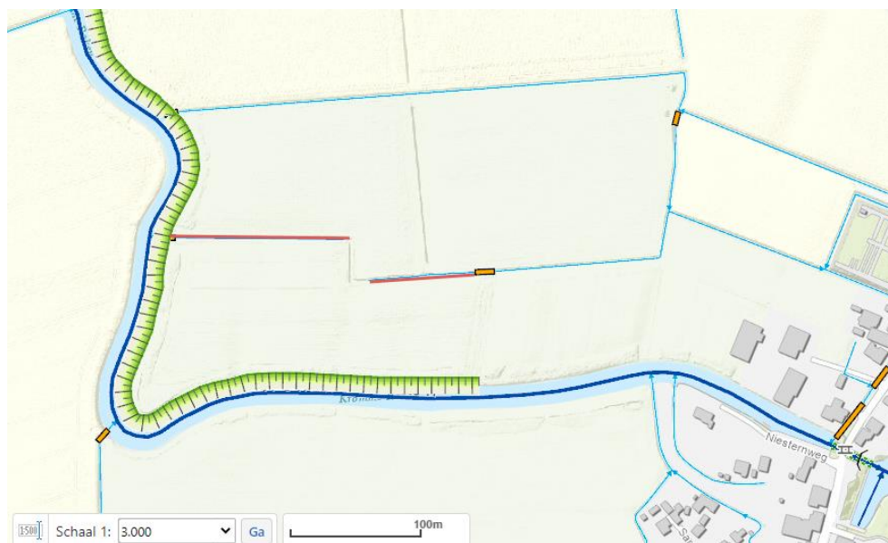
Figuur 2: Locatie kadastraal bekend LEE02K741. De rode lijnen geven de te dempen watergangen weer.