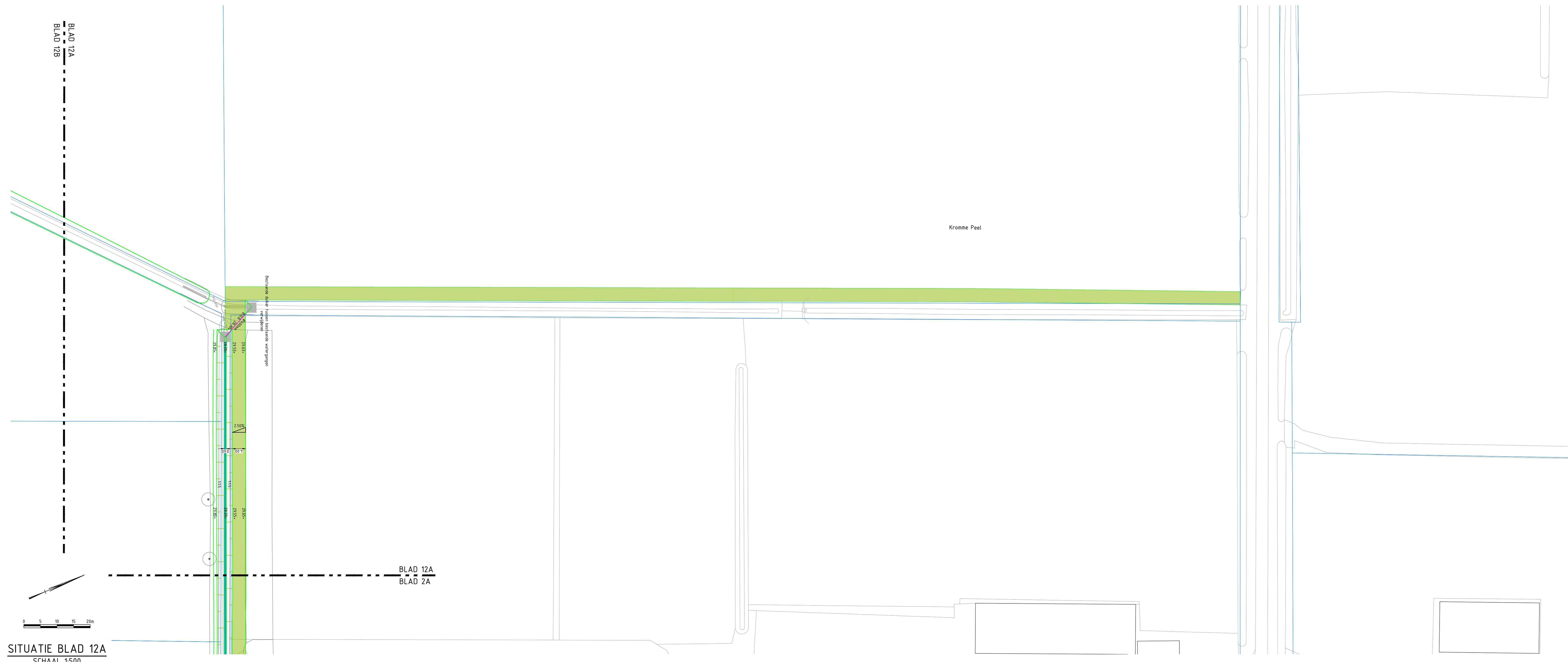
SITUATIE BLAD 12A SCHAAL 1:500