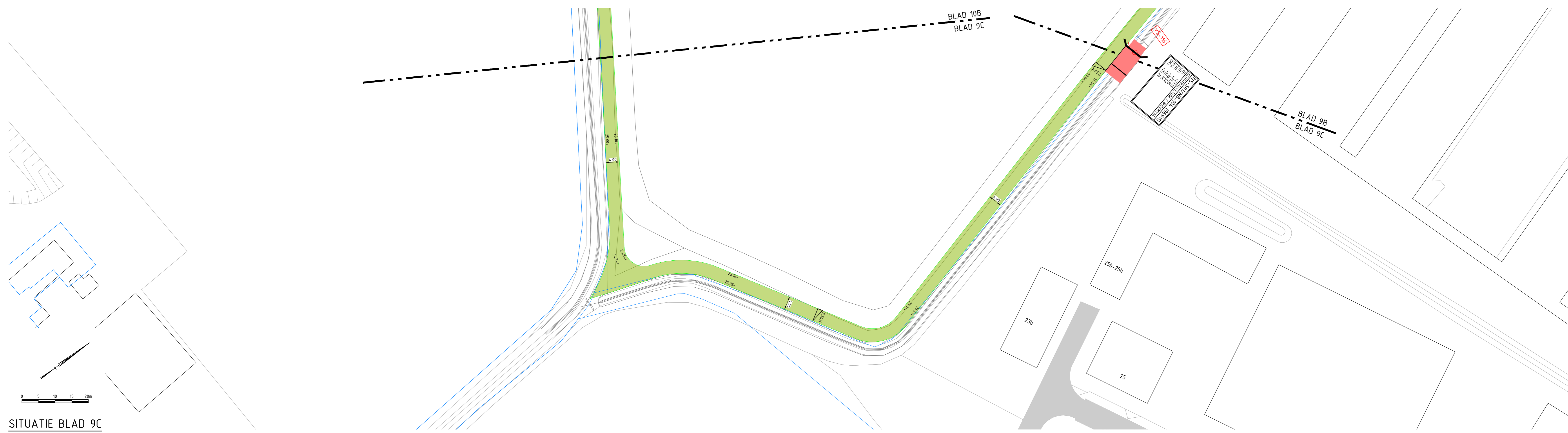
SITUATIE BLAD 9C SCHAAL 1:500