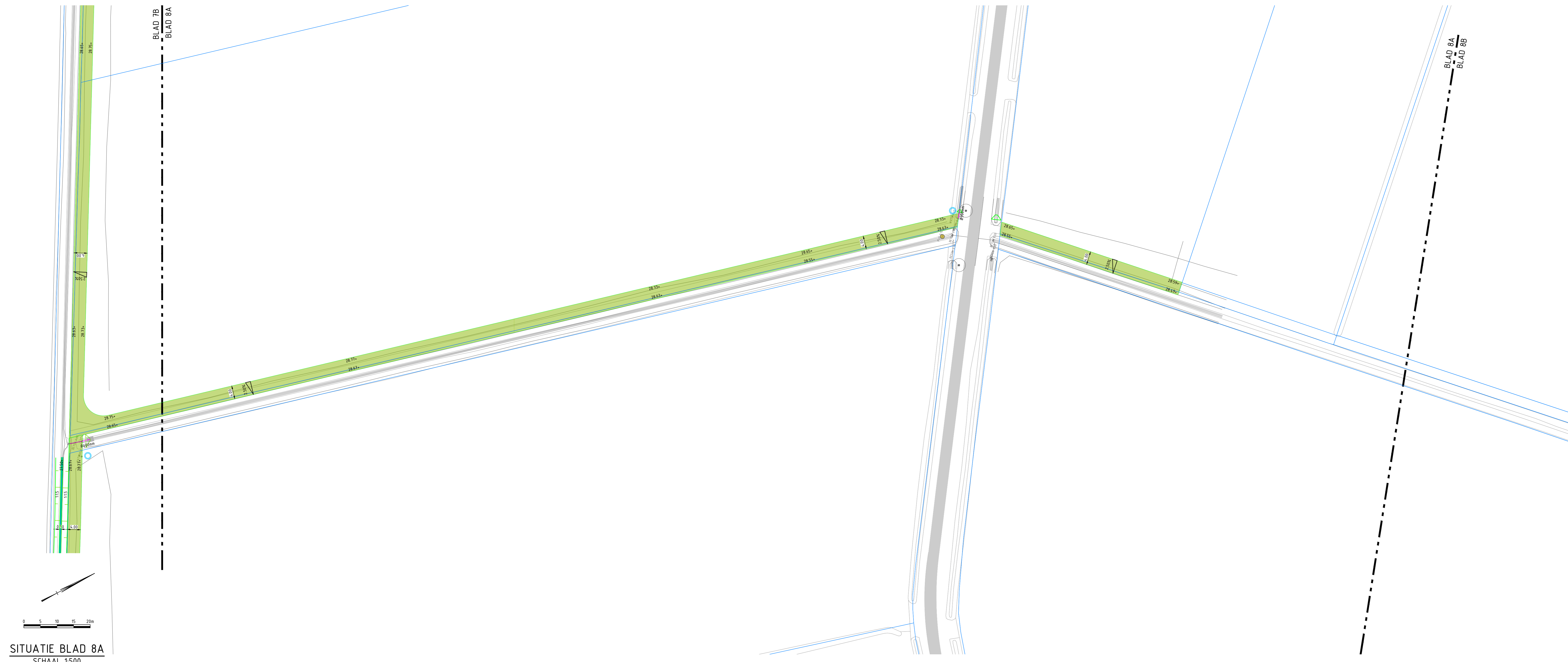
SITUATIE BLAD 8A SCHAAL 1:500