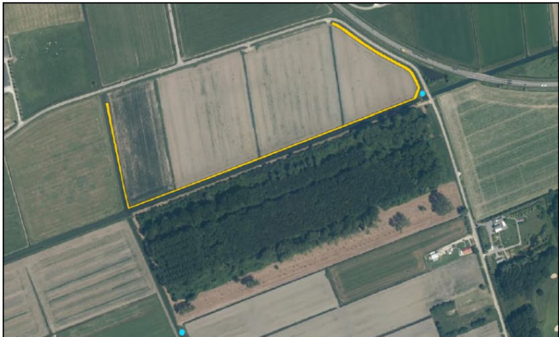
Figuur 2. De locatie van de aan te leggen natuurvriendelijke oever aan één zijde van de watergang over een lengte van ca. 1 km (oranje lijn) en de twee te realiseren marterhopen (blauwe stippen). De marterhopen worden minimaal 3 maanden voorafgaand aan de werkzaamheden gerealiseerd.