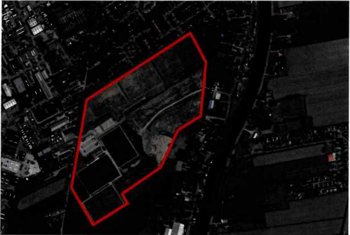
Afbeelding 1, globale ligging van het plangebied (rode contour) in Meerkerk. (bron: Google Earth)

Bron: "Projectplan flora en fauna De Weide II te Meerkerk" van 16 augustus 2022