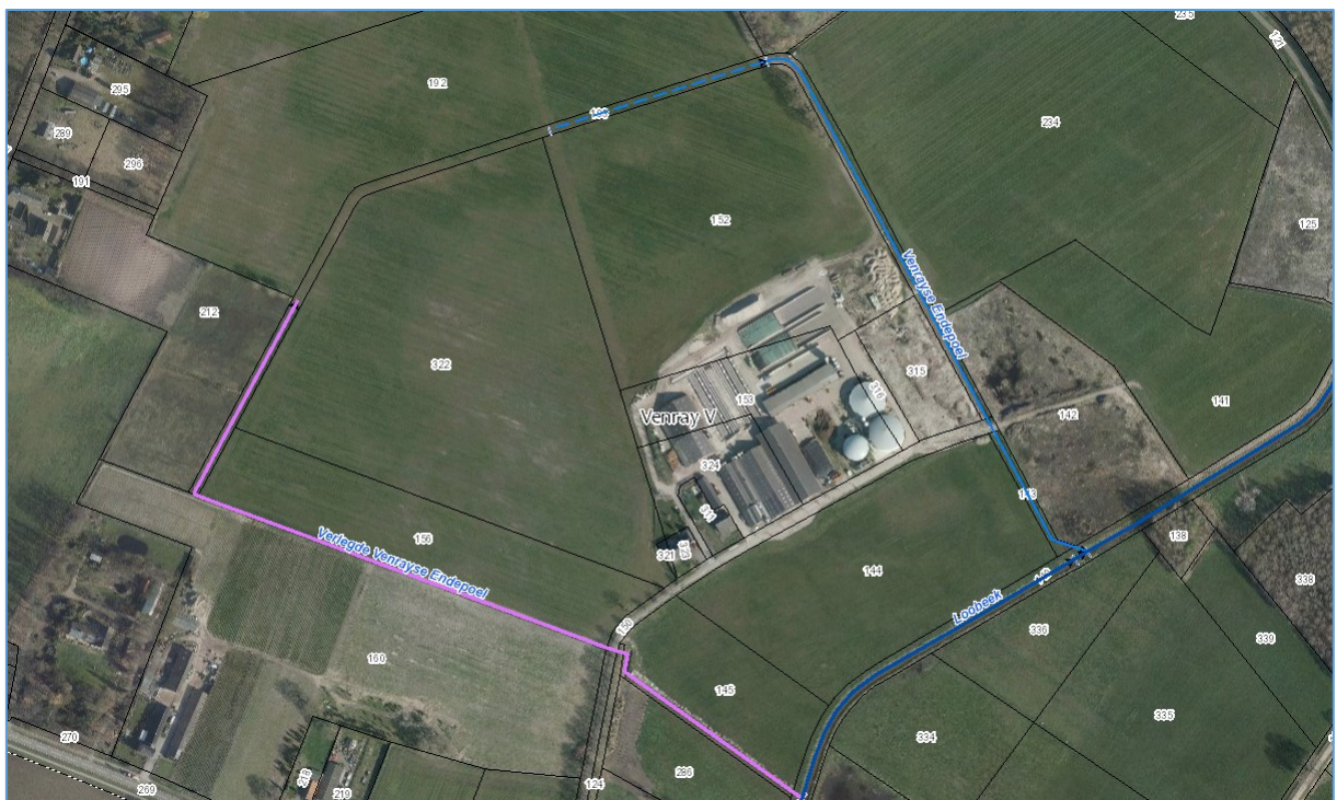
Afbeelding 1 : nieuwe situatie met de gedempte Venrayse Endepoel (blauw) en de nieuw gegraven Verlegde Venrayse Endepoel (violet)

De nieuwe waterloop krijgt voor het volledige tracé de status primaire waterloop. De onderhoudsplichtige van de 'Verlegde Venrayse Endepoel' wordt Waterschap Limburg.