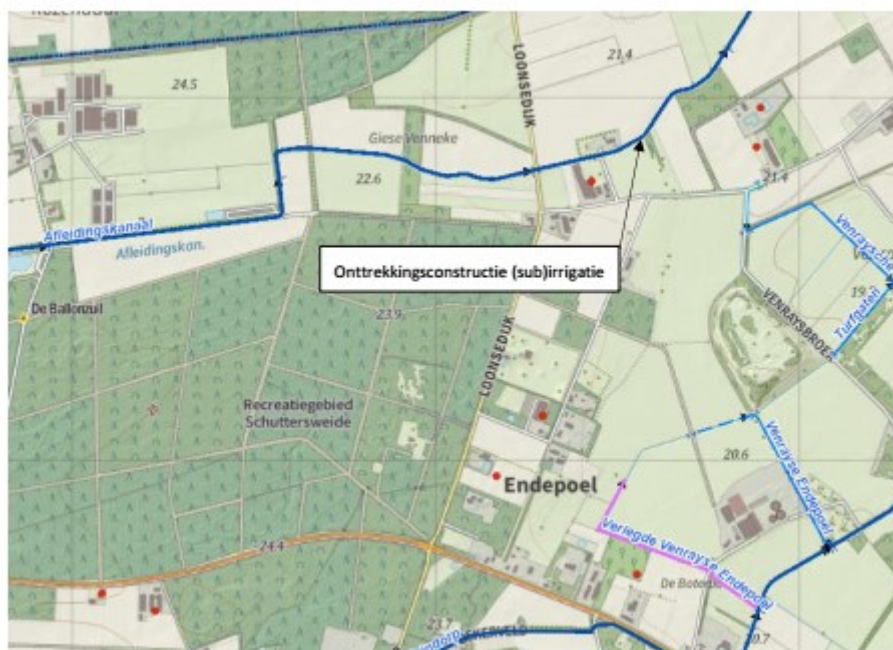
Afbeelding 3: locatie onttrekkingsconstructie (sub)irrigatie

De aangelegde drainage kan bij droogte eveneens gebruikt worden als (sub)irrigatie. De benodigde hoeveelheid water wordt onttrokken uit de primaire watergang Afleidingskanaal. Op onderstaande afbeelding is de locatie van het onttrekkingspunt aangegeven.