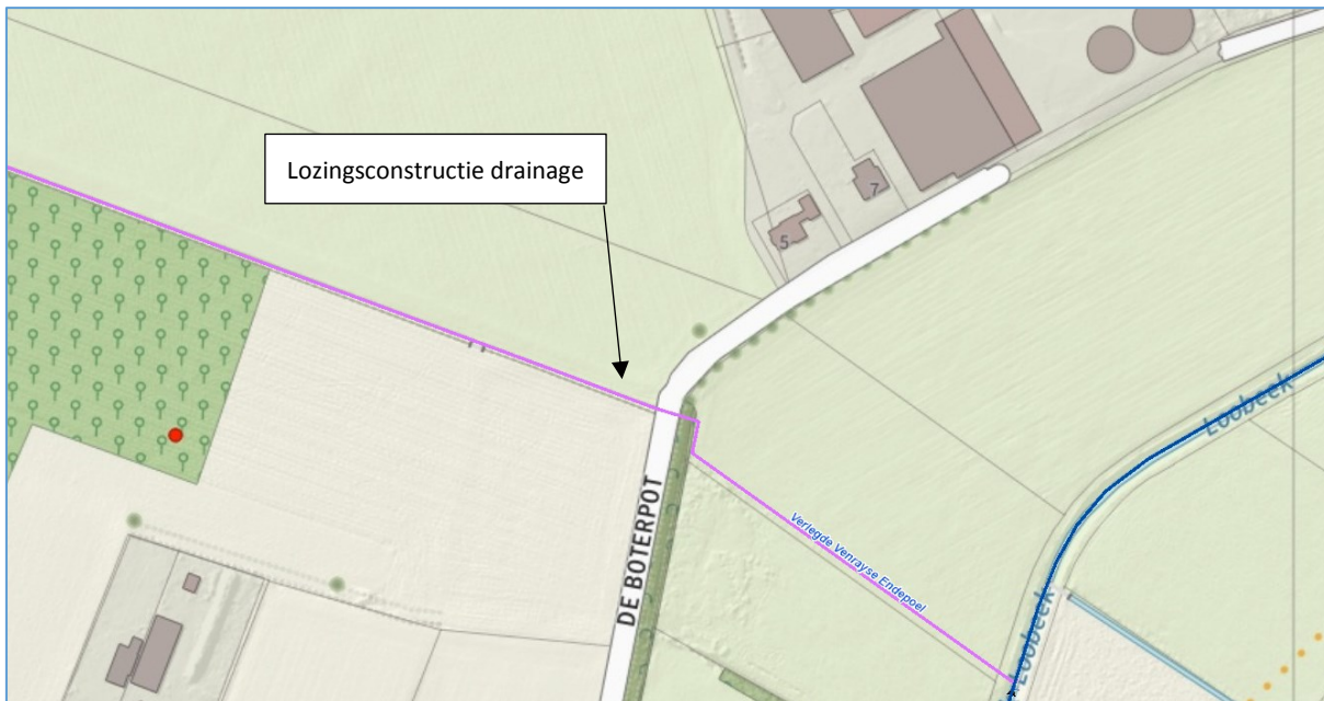
Afbeelding 2: locatie lozingsconstructie drainage

De aangelegde drainage kan bij droogte eveneens gebruikt worden als (sub)irrigatie. De benodigde hoeveelheid water wordt onttrokken uit de primaire watergang Afleidingskanaal. Op onderstaande afbeelding is de locatie van het onttrekkingspunt aangegeven.