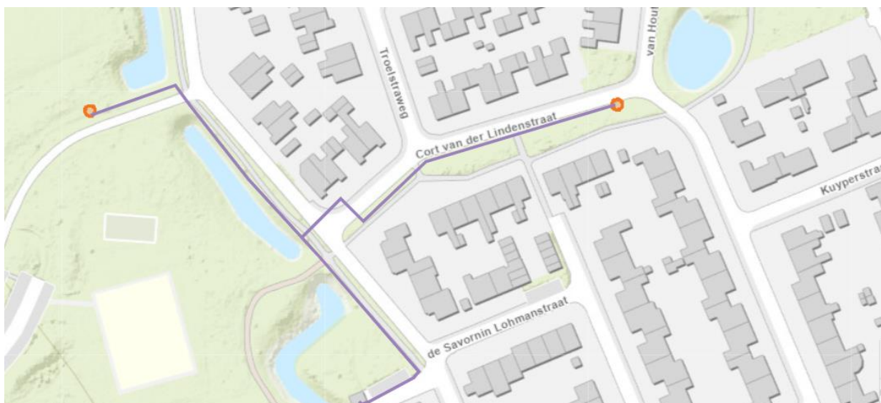
Figuur 1: Locatie van werkzaamheden. De paarse lijn geeft het leidingtracé weer. De oranje cirkels geven de locatie van aan te leggen netstations weer.

Het dagelijks bestuur van het waterschap Noorderzijvest heeft op 28 maart 2023 van namens _____ een aanvraag ontvangen om een vergunning als bedoeld in hoofdstuk 6 van de Waterwet (Wtw). De aanvraag betreft het aanleggen van een leidingtracé waarbij wordt gegraven langs secundaire watergangen en diverse duikers worden gekruist nabij Heemskerkstraat 27 te Zuidhorn, zoals hieronder globaal is weergegeven in figuur 1.