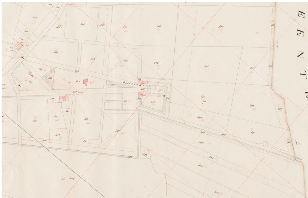
Figuur 3.2: Kadastrale minuutplan uit 1832. Toen nog was de vijver als gelijkbenige driehoek aangelegd. Roodbeen herontwierp deze vijver in 1836 als slingerende langwerpige vijver (zoals thans nog aanwezig).

Waarde – Beekdal: De vergunning is voor alle dijkvakken benodigd. Verwacht wordt dat de verlening van deze vergunning vanuit cultuurhistorisch / landschappelijk perspectief niet problematisch is. Immers betekent het versterken van de kades (waar ophoging in de regel onderdeel van uit maakt) weinig voor de wezenlijke kenmerken (kleinschaligheid, meanderende beken en de algemene karakteristiek met bossen, essen en heides). Wel heeft het