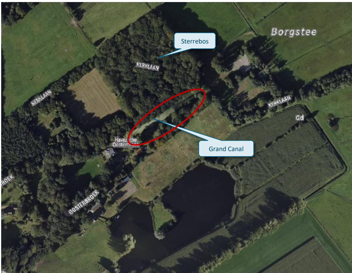
Figuur 3.3: Onderdelen van het beschermd dorpsgezicht

verduikeren van de sloot (optie benoemd tijdens de schetssessies t.b.v. voorkomende schade bever) een negatieve impact. Die werkzaamheden vallen echter buiten de begrenzing van het beschermd dorpsgezicht, maar hebben wel een dubbelbestemming 'waarde – beekdal'. Alsnog dient deze impact gecompenseerd of gemitigeerd te worden. Er is naar verwachting geen grond de vergunningen op het onderdeel beschermd dorpsgezicht te weigeren. Voor zover voor meerdere werken en/of werkzaamheden vergunningen worden gevraagd en deze in één (inrichtings)plan zijn ondergebracht, wordt dit plan in zijn geheel in de beoordeling betrokken.