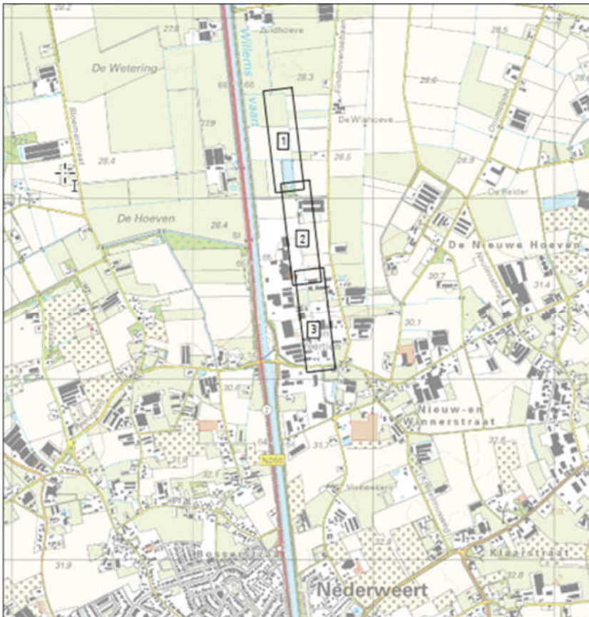
Figuur 1 Situering locatie knelpunt Winnerstraatlossing

De Winnerstraatlossing en Eindhovensebaan liggen ten noorden van Nederweert en ten oosten van de Zuid-Willems Vaart. In figuur 1 en 2 is de ligging van de locaties weergegeven.