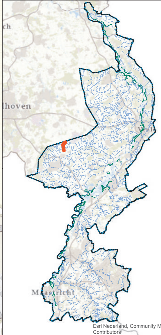
Overzichtskaartje (schaal 1:650.000)