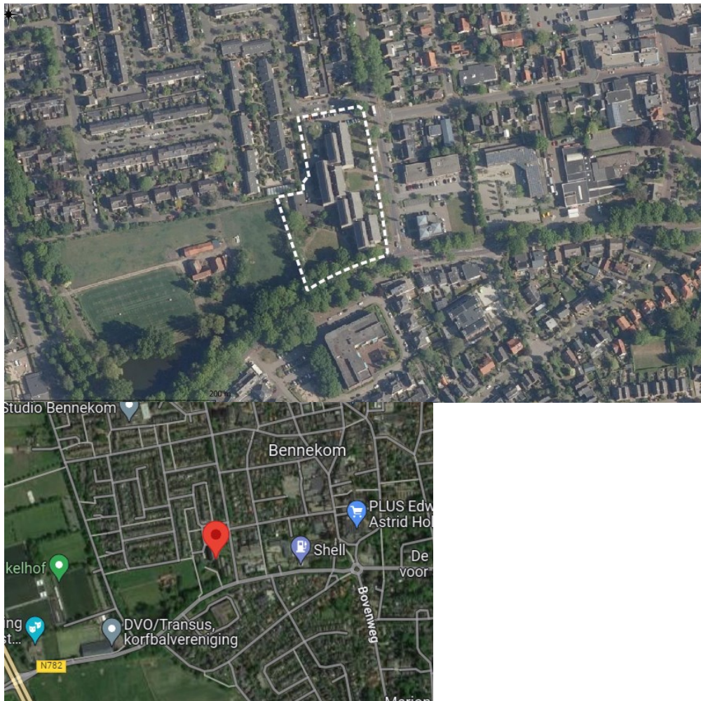
Figuur 1: Plangebied (Econsultancy, 2022)