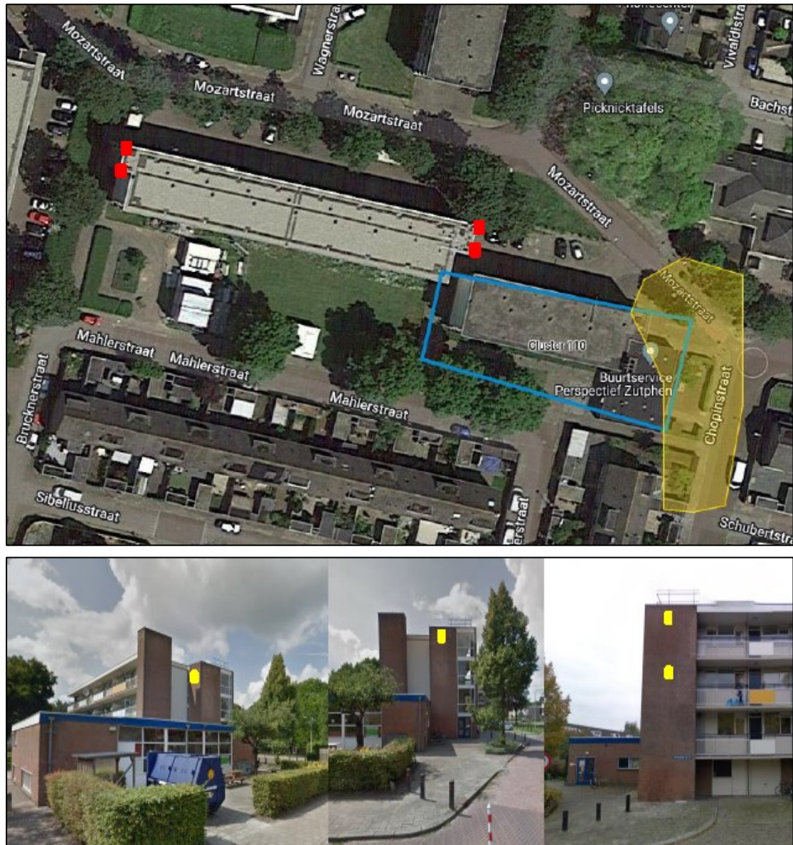
Figuur 2. De locaties van de tijdelijke (boven) en permanente (onder) voorzieningen voor gewone dwergvleermuis. Op de bovenste afbeelding zijn de locaties van de 4 tijdelijke vlemmuiskasten van het type Schwegler 1FQ (of soortgelijk) met rode vierkanten weergegeven, terwijl het te renoveren complex blauw omlijnd is. Op de onderste afbeelding zijn de 4 permanente inbouwkasten van het type Schwegler 2FR (of soortgelijk) met gele vierkanten weergegeven.