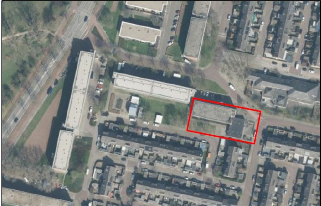
Figuur 1. De ligging en begrenzing van het plangebied aan de Mozartstraat 50 t/m 74 te Zutphen (rood omlijnd).