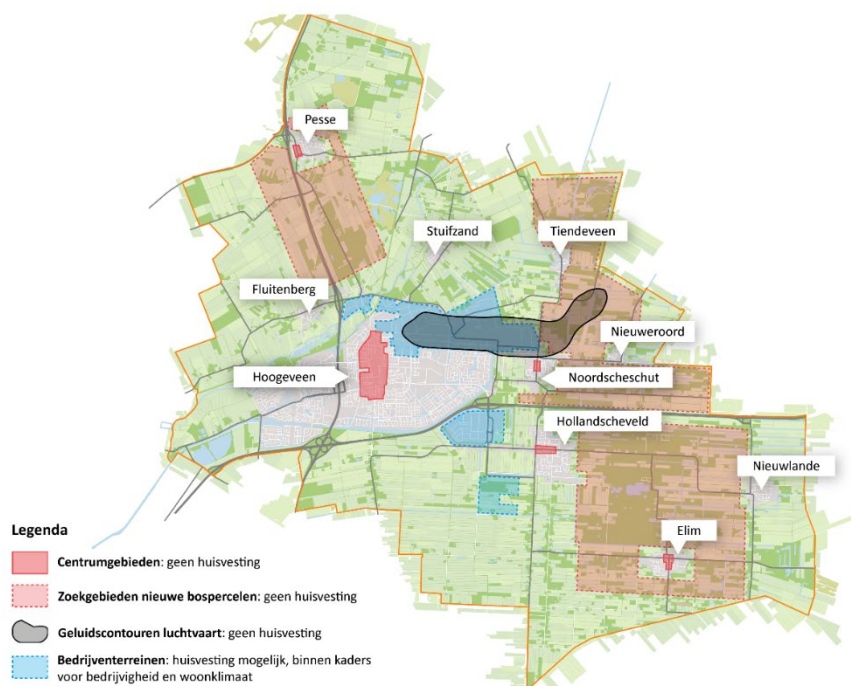
Figuur 1: Gemeente Hoogeveen. Ontwikkelrichting gebieden huisvesting arbeidsmigranten (short- en mid-stay).