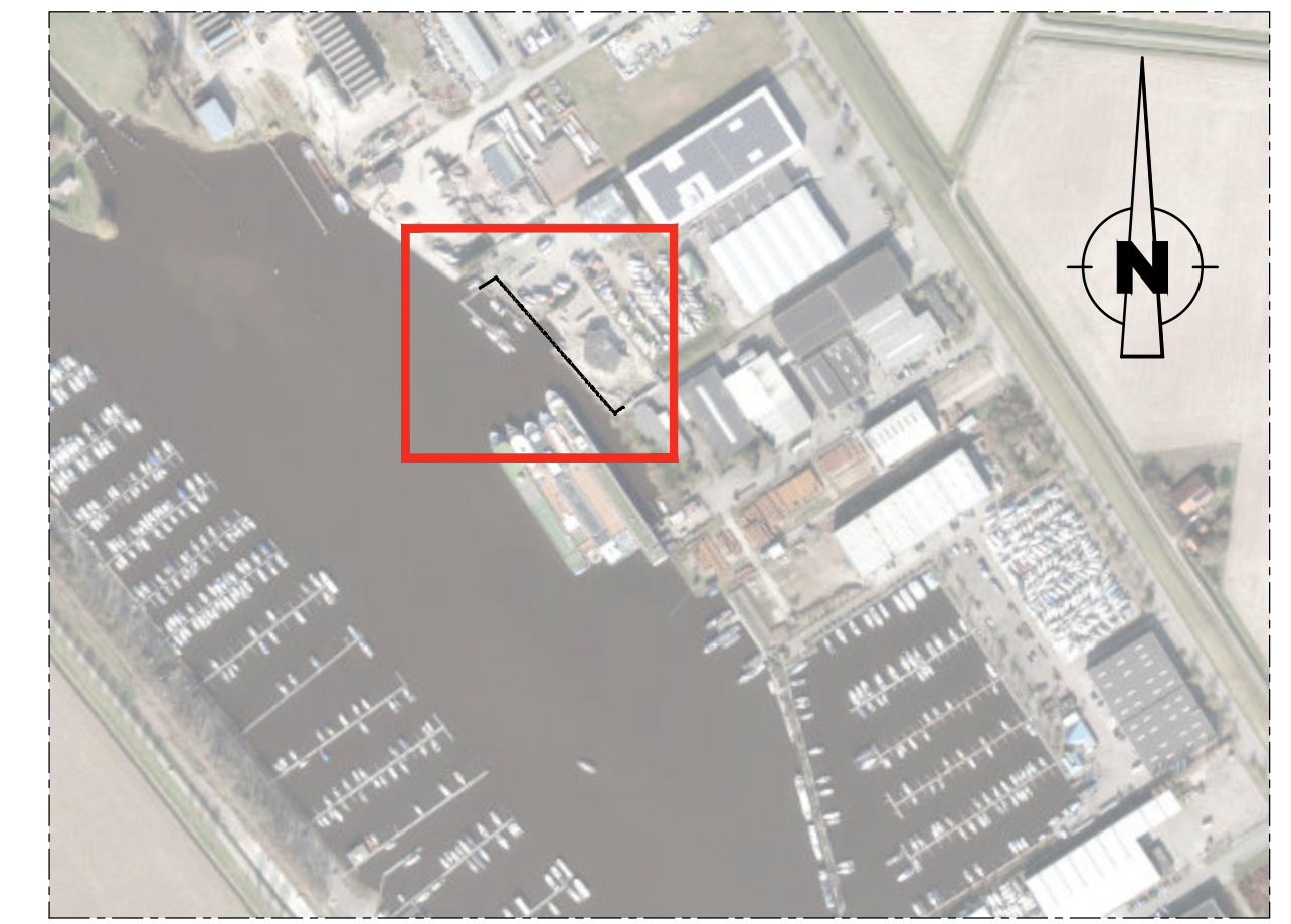
SITUATIE (schaal 1:5000)