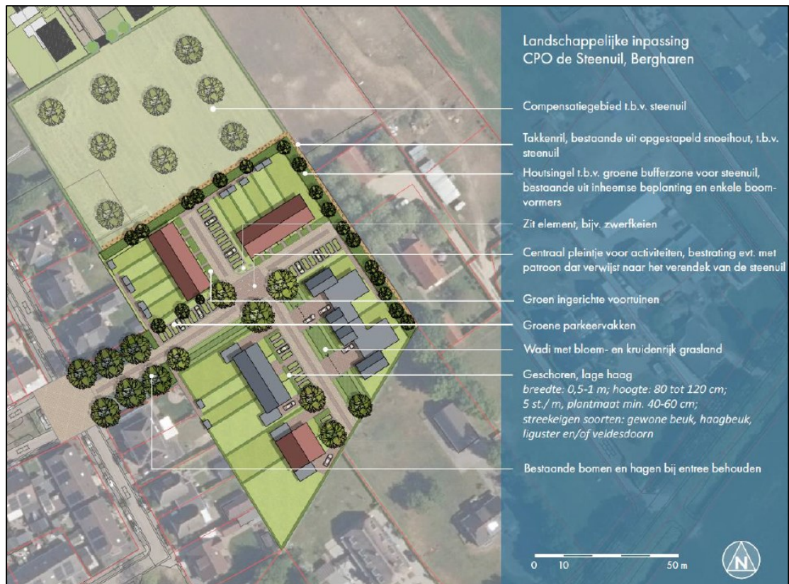
Figuur 5. Een schematisch overzicht van de beoogde nieuwe situatie met 20 nieuwe woningen met bijbehorende groeninrichting bestaande uit het steenuilcompensatiegebied ten noorden, takkenrillen, houtsingels, zitelementen (bijv. zwerfkeien en rasterpalen), een wadi, groen ingerichte voortuinen en parkeervlakken en bomen (uit: 'Activiteitenplan ontheffing Wnb soortbescherming | Woningbouwproject De Steenuil in Bergharen' (Staring Advies, d.d. 9 september 2022)).