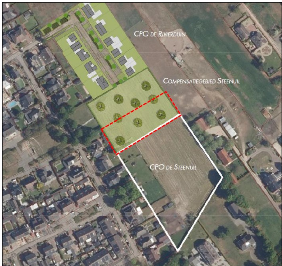
Figuur 2. De locatie van het plangebied ('CPO De Steenuil'), de reeds gerealiseerde woonwijk met 12 woningen ('CPO De Rivierduin') met het bestaande compensatiegebied voor steenuil én de uitbreiding van het compensatiegebied met 2.100 m 2 voor CPO De Steenuil (rood gestippeld omlijnd).