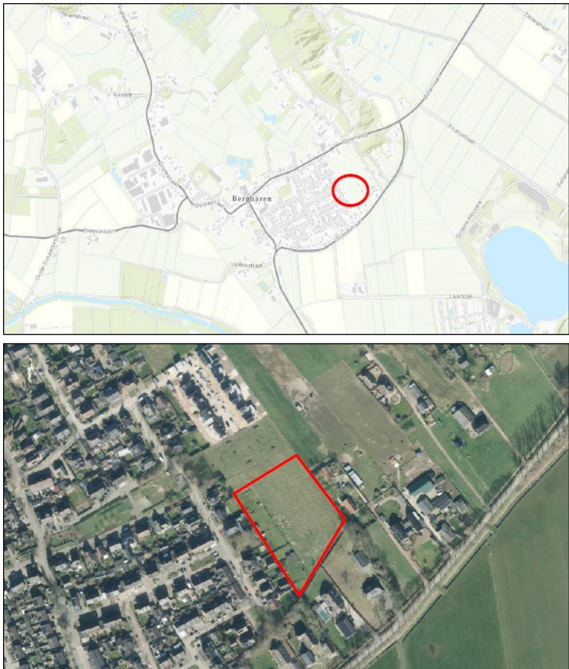
Figuur 1. De ligging en begrenzing van het plangebied ter grootte van circa 0,78 hectare aan de Dorstvlegel te Bergharen (rood omlijnd).