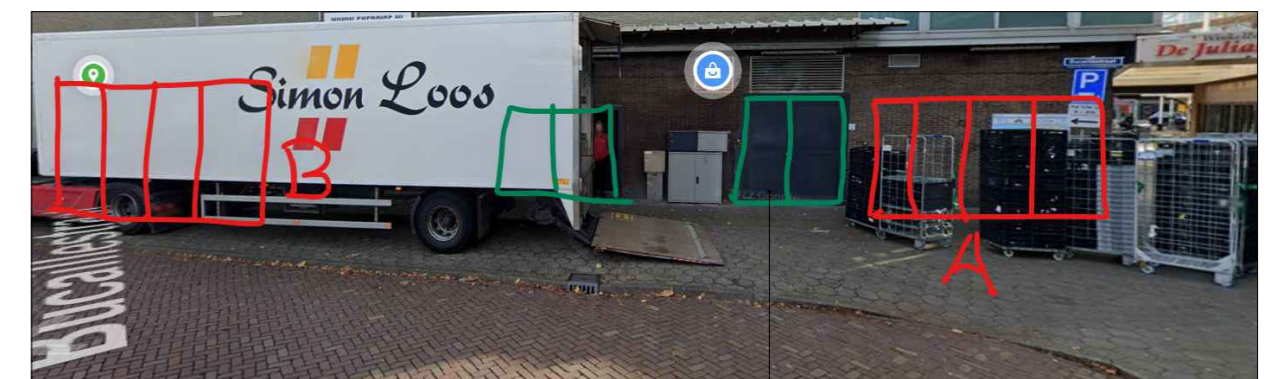
deuren in groen