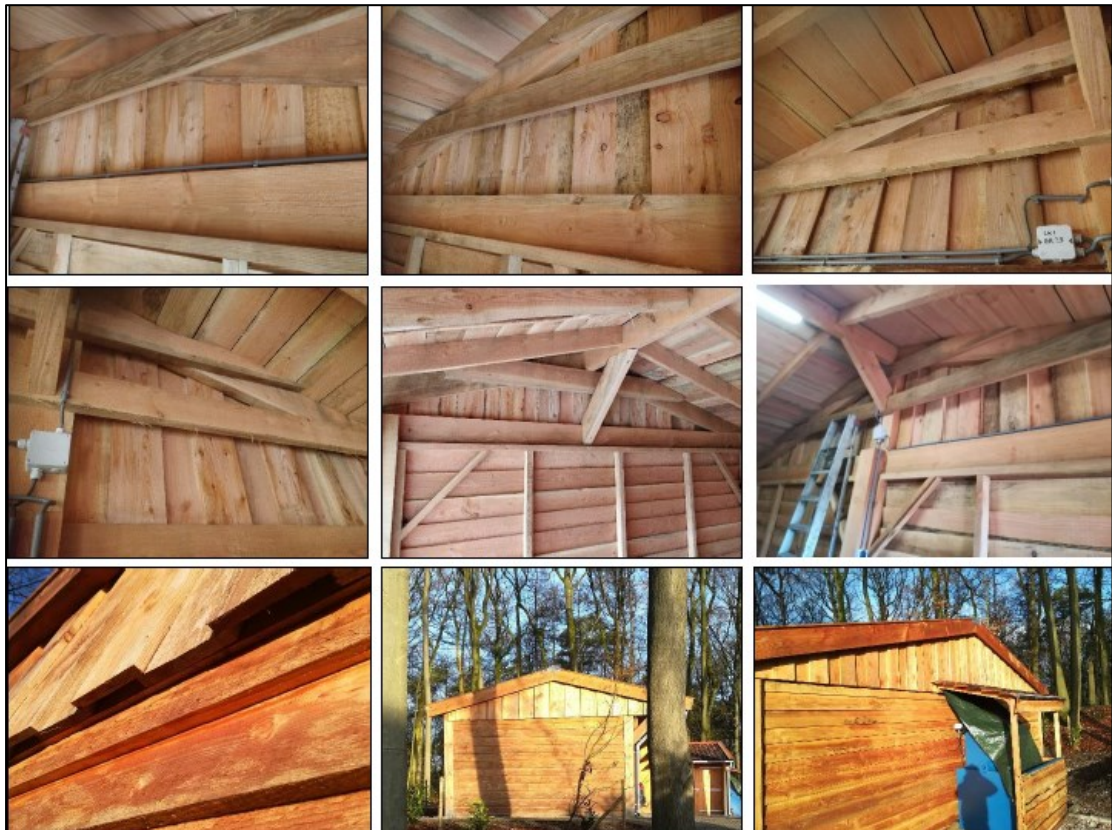
Figuur 3. Een impressie van de gecreëerde duurzame verblijfplaatsen voor vleermuizen achter gevelbetimmering van de (nieuwe) kapschuur. Bovenste en middelste rij : binnenzijde van de permanente verblijfplaatsen in de kapschuur. Onderste rij : toegangen aan de onderzijde van de betimmering (links) en een overzicht van de buitenzijde (midden en rechts).

De kapschuur is opgebouwd uit dubbele betimmering op 3 kopsen kanten met 18 kierende planken per kopsen kant. Aan de onderzijde van de planken is toegangsruimte voor vleermuizen gemaakt van circa 8 tot 10 cm bij 2 cm breed. Elke kopsen kant is goed voor 4 duurzame verblijfplaatsen, die zowel tijdelijk als permanent aanwezig zullen zijn. In totaal zijn dat er dus 12.