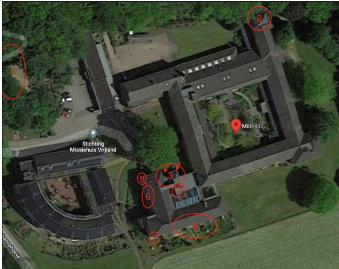
Afbeelding 1. Locaties van de aangebrachte maatregelen: