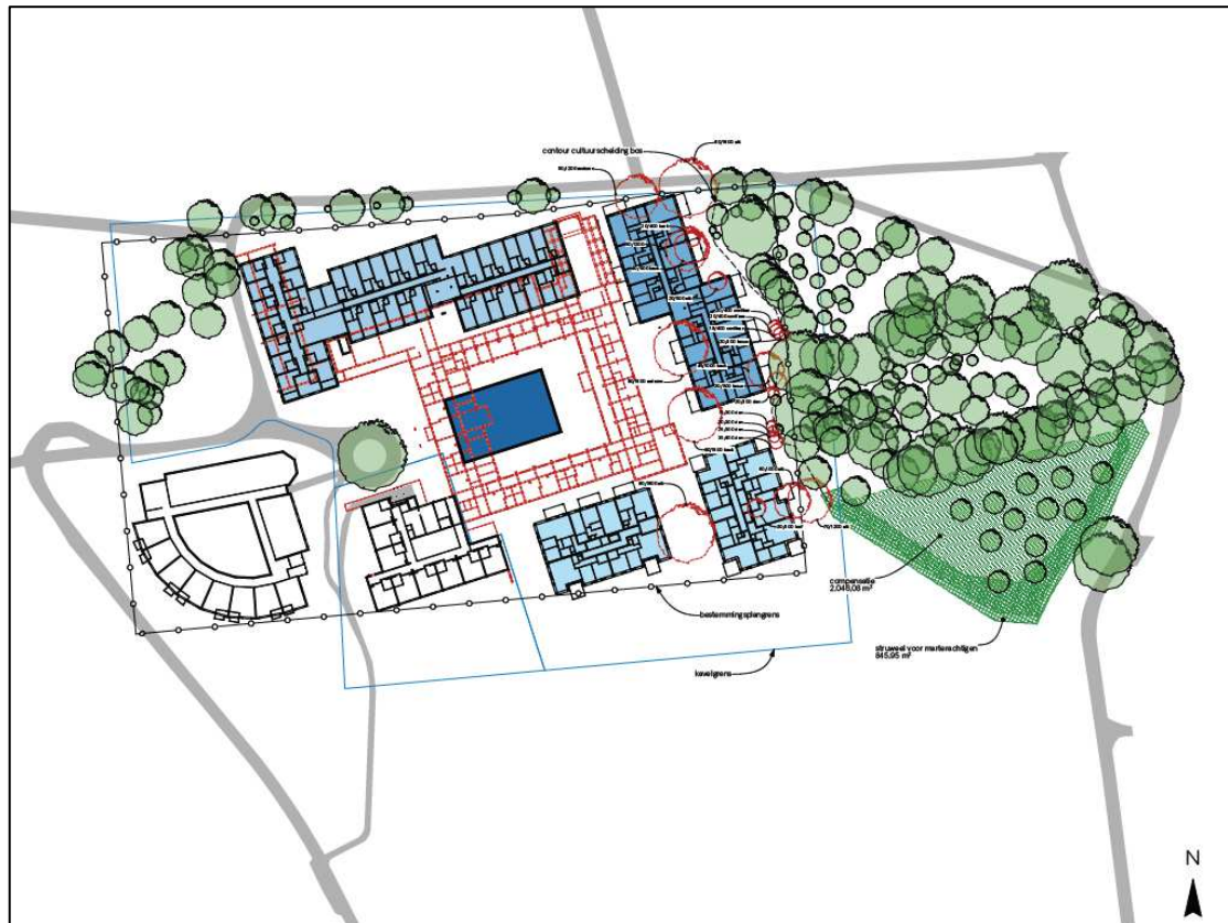
Figuur 5. Een schets van de inrichting van het plangebied in de nieuwe situatie. In blauw is de geplande nieuwbouw weergegeven. In rood de huidige bebouwing en bomen/coniferen welke gesloopt en verwijderd worden. Aan de westelijk gelegen zijde wordt een nieuwe ontsluitingsweg gerealiseerd, die het bosgebied niet doorsnijdt, zoals eerder het plan was in het oostelijk gelegen deel door het bosje. Het groen gearceerde gedeelte geeft de plek voor aanplant van nieuw bos en struweel weer, ter grootte van 2.892 m 2 met voorzieningen voor kleine marterachtigen en tevens potentie voor soorten als das en hazelworm.