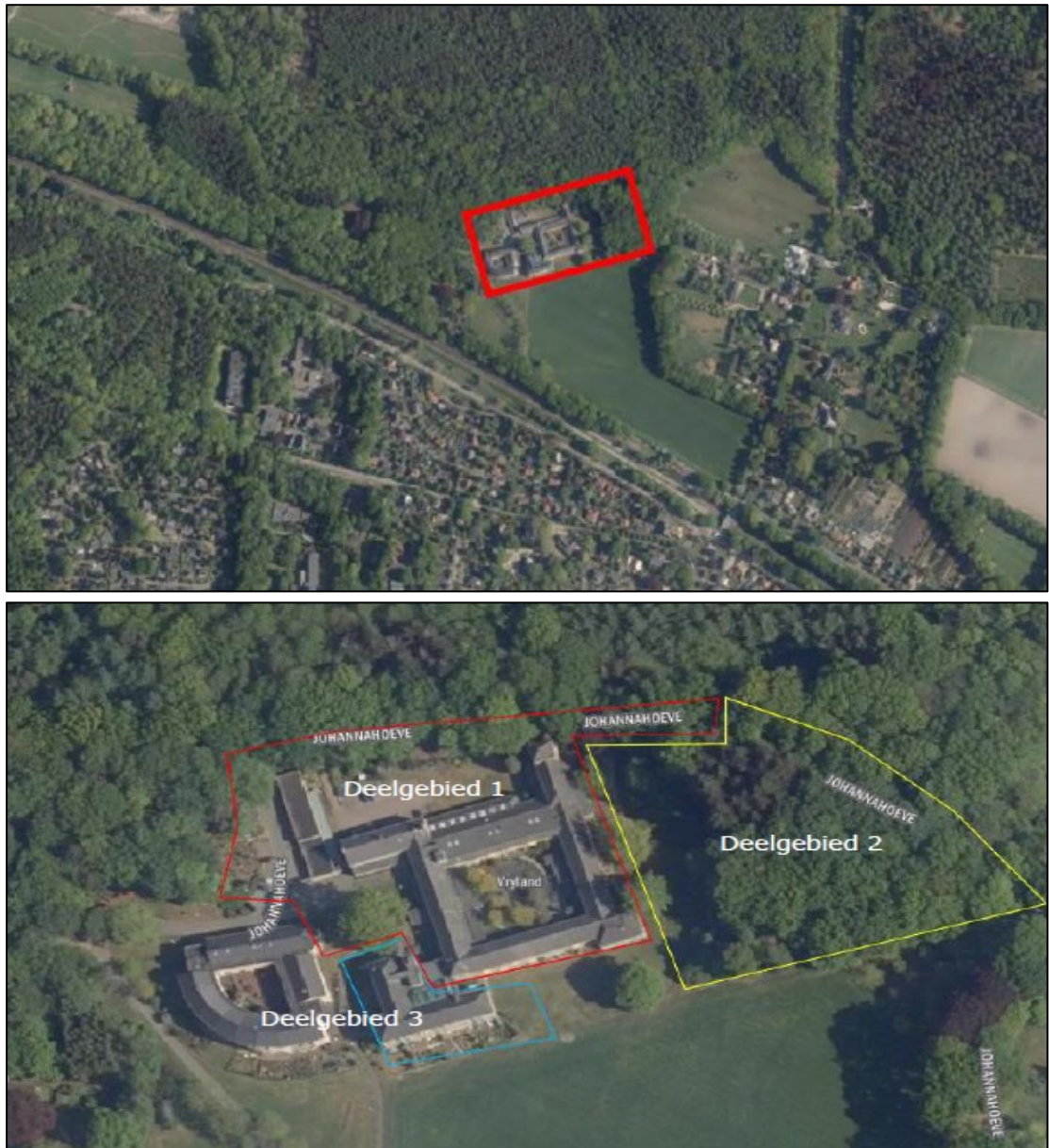
Figuur 1. De ligging en begrenzing van het plangebied aan de Johannahoeve 2 te Oosterbeek. Op de onderste afbeelding is een verdeling van 3 deelgebieden met verschillende werkzaamheden per gebied weergegeven. De bebouwing in gebied 1 wordt grotendeels gesloopt en gerenoveerd. In deelgebied 2 loopt een onverhard en onbenut pad. Dit pad blijft in de nieuwe situatie ongemoeid en onbenut, in tegenstelling tot eerdere plannen. Ook worden er in het bosje in deelgebied 2 geen bomen gekapt ten gunste van nieuwbouw. De bebouwing (gebouw '95) in deelgebied 3 is later bijgebouwd en blijft op enkele kleine aanpassingen ongemoeid.