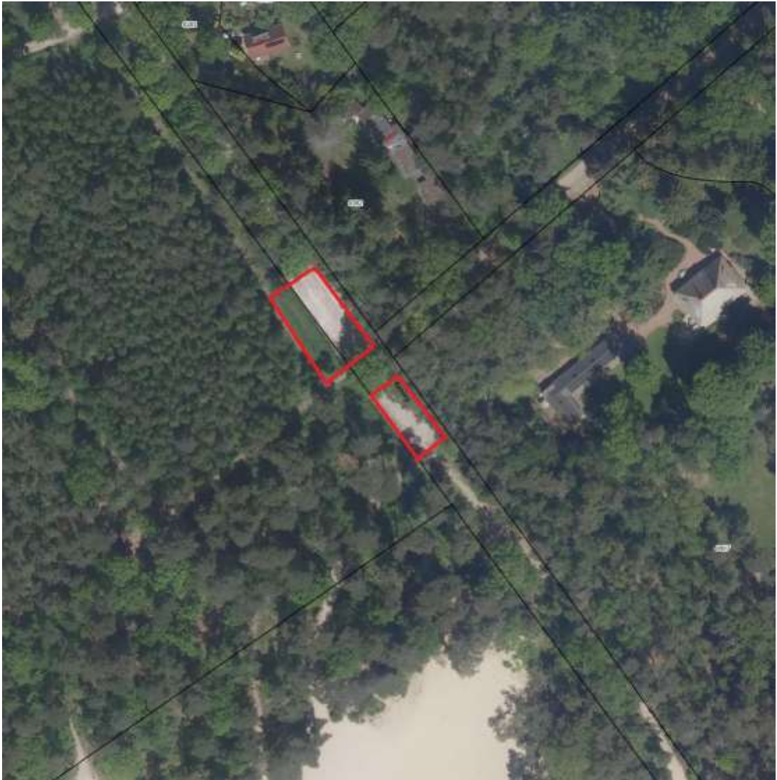
Figuur 5: Ligging herplantlocatie op oude parkeerplaats (9 are). Kadastrale percelen: Doornspijk, sectie E, nummer 4502 en Doornspijk, sectie D, nummer 5299.