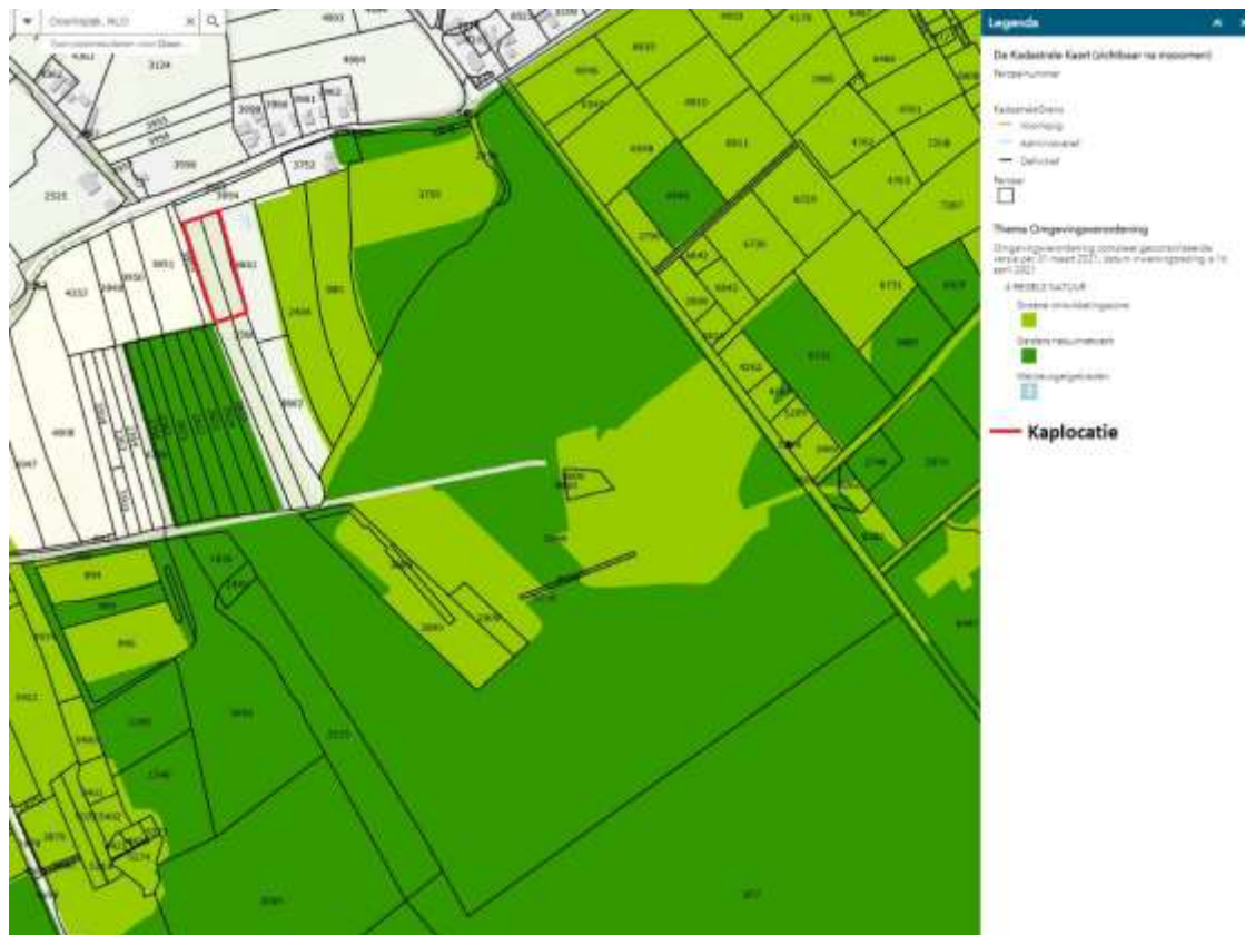
Figuur 2: Kaplocatie, nieuwe parkeerplaats, ten opzichte van GNN en GO.