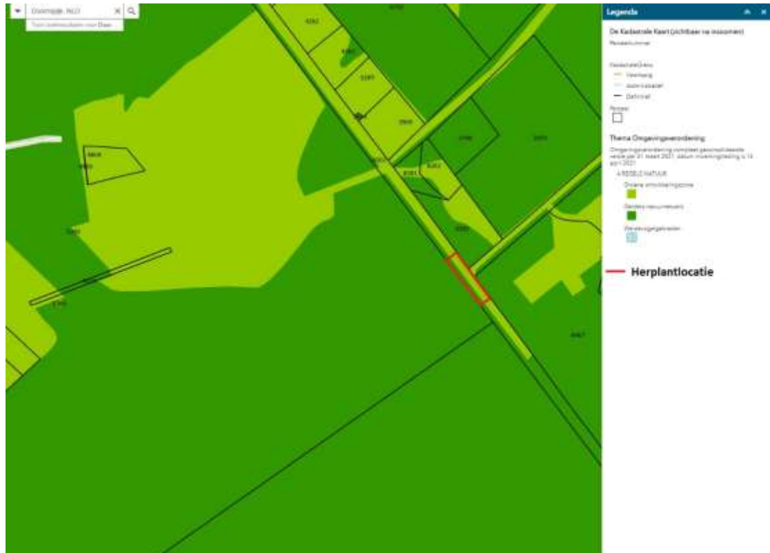
Figuur 6: Herplantlocatie ten opzichte van GNN en GO.