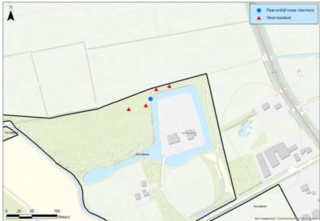
Figuur 2: locaties van de opgehangen vleermuiskasten aangegeven met rood. In blauw is de locatie van de huidige aan te tasten verblijfplaats van de rosse vleermuis weergegeven (Van Dijk, 2022)