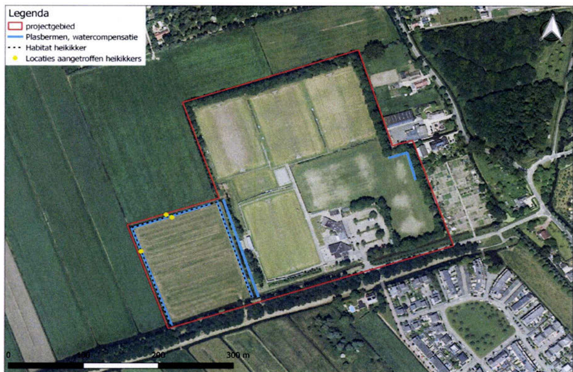
Figuur 1: projectgebied met vastgestelde functies.