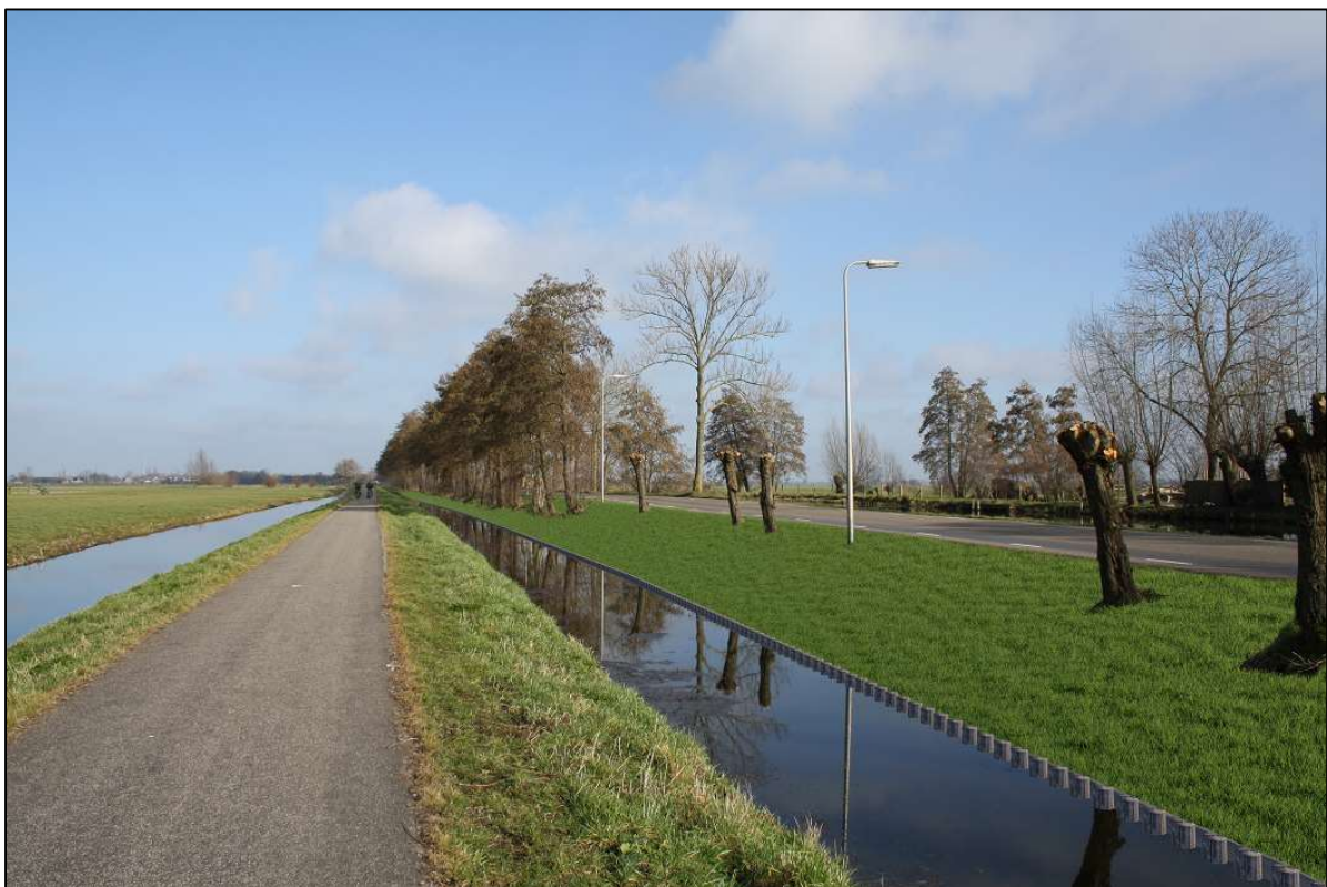
Figuur 4 Impressiebeeld na afronding van de werkzaamheden. Het binnentalud is verbreed en de palen van het stabiliteitsscherm steken 15 centimeter boven het waterpeil uit. De bomen worden tijdens het groot onderhoud van de gemeente teruggesnoeid naar knotbomen.