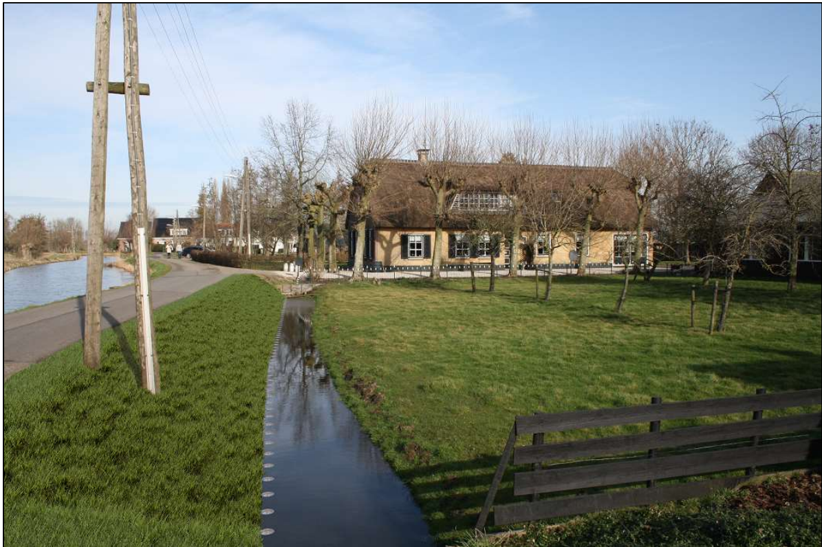
Figuur 3 Impressiebeeld na afronding van de werkzaamheden. Het binnentalud is breder geworden en de palen van het stabiliteitsscherm zijn gelijk met het waterpeil.