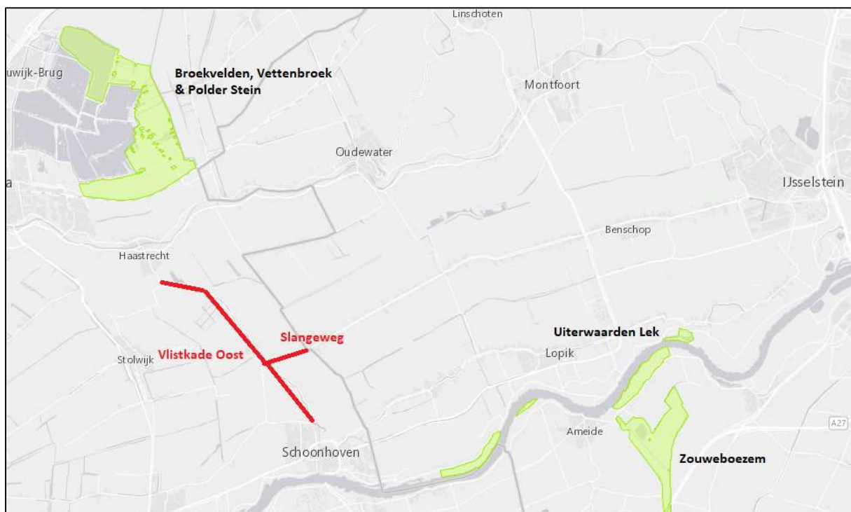
Figuur 5 Overzicht van de locatie van de werkzaamheden ten opzichte van de nabijgelegen Natura 2000-gebieden. Rode lijn is niet het exacte projectgebied maar een indicatie.

De beoogde werkzaamheden vinden plaats buiten de begrenzing van Natura 2000-gebied. Uit de Quickscan blijkt dat de dichtstbijzijnde Natura 2000-gebieden 'Broekvelden, Vettenbroek & Polder Stein' en 'Uiterwaarden Lek' liggen op een afstand van respectievelijk 1,5 en 4 kilometer. Van een directe aantasting en afname van areaal aan beschermd natuurgebied is daarom geen sprake. Het nabijgelegen Natura 2000-gebieden ligt op voldoende ruime afstand dat geen negatieve invloeden verwacht worden van factoren die met een korte reikwijdte op afstand werken, als bodemtrillingen, geluids- en lichtbelasting. De enige factor die op grotere afstand werkzaam is en op basis van zijn reikwijdte van invloed kan zijn, betreft de factor stikstofdepositie.