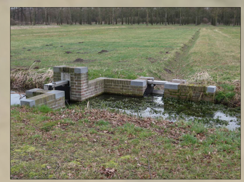
Principe afbeelding van een verdeelwerk