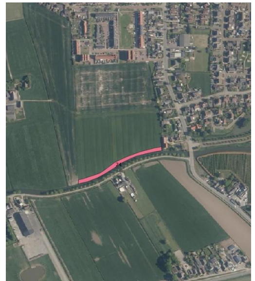
Figuur 2: locatie 024

De locatie ligt ter hoogte van Tielsestraat in Maurik, gemeente Buren, op perceel MRK01 L 2968 (figuur 2). De natuurvriendelijk oever wordt over een lengte van ca. 220 meter aangelegd, aan de noordoever van de A-watergang met nummer 332435. De watergang is onderdeel van een aangewezen KRW-waterlichaam. De bodem van de berm wordt ca. 0,5 meter breed en komt 50 cm onder zomerpeil, op NAP +2,6 meter. Het talud krijgt een helling van 1:3. Daarnaast ligt een onderhoudsstrook van 4,5 meter breed. Op de insteek worden knotwilgen geplant.