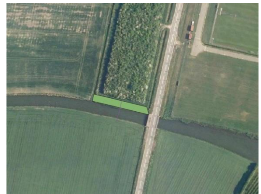
Figuur 3: locatie 030

De locatie ligt ter hoogte van de Verbindingsweg, Maurik in de gemeente Buren, op perceel MRK01 L 2969 (figuur 3). Over een lengte van ca. 65 meter wordt een natuurvriendelijk oever aangelegd, aan de noordoever van de A-watergang met nummer 216891. De watergang is onderdeel van een aangewezen KRW-waterlichaam. De bodem van de berm wordt 0,5 meter breed en komt 50 cm onder zomerpeil, op NAP +2,6 meter. Het talud wordt met een helling van 1:3 aangelegd. Daarnaast ligt een onderhoudsstrook van 4 meter breed.