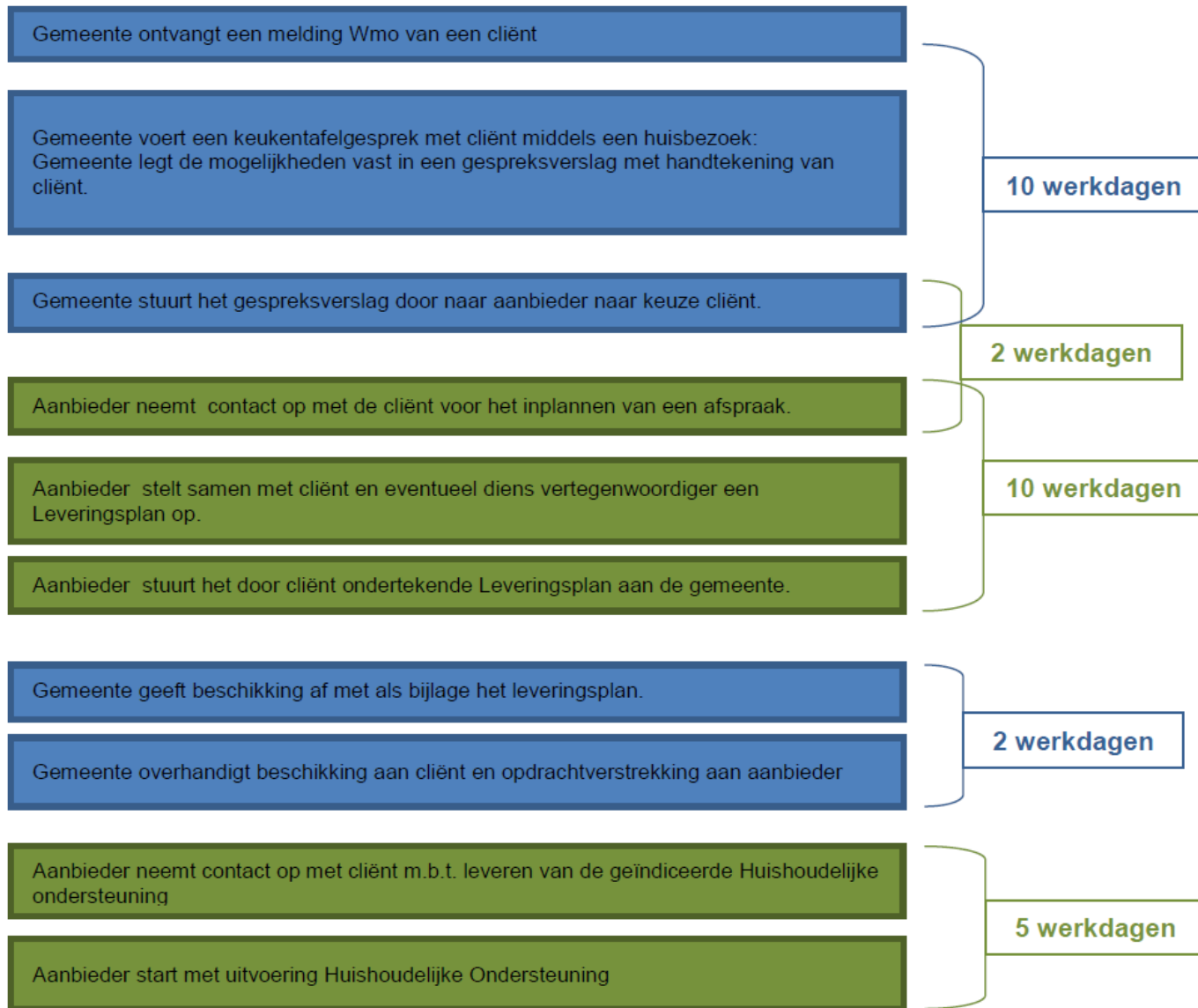
Bijlage 6 Frequentietabel Huishoudelijke