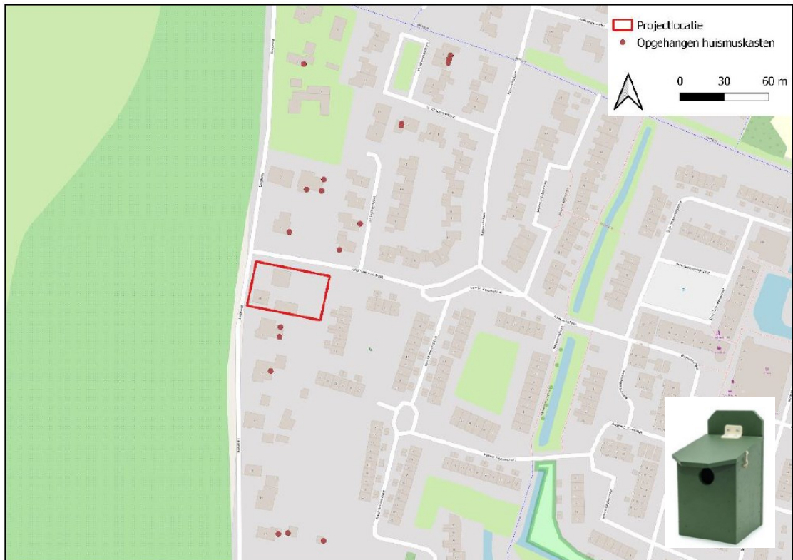
Figuur 3. Locaties tijdelijke alternatieve nestlocaties (type systeem-nestkast Huismus Eco 34 mm) voor huismus (rode stippen) ten opzichte van het projectgebied (rode kader).