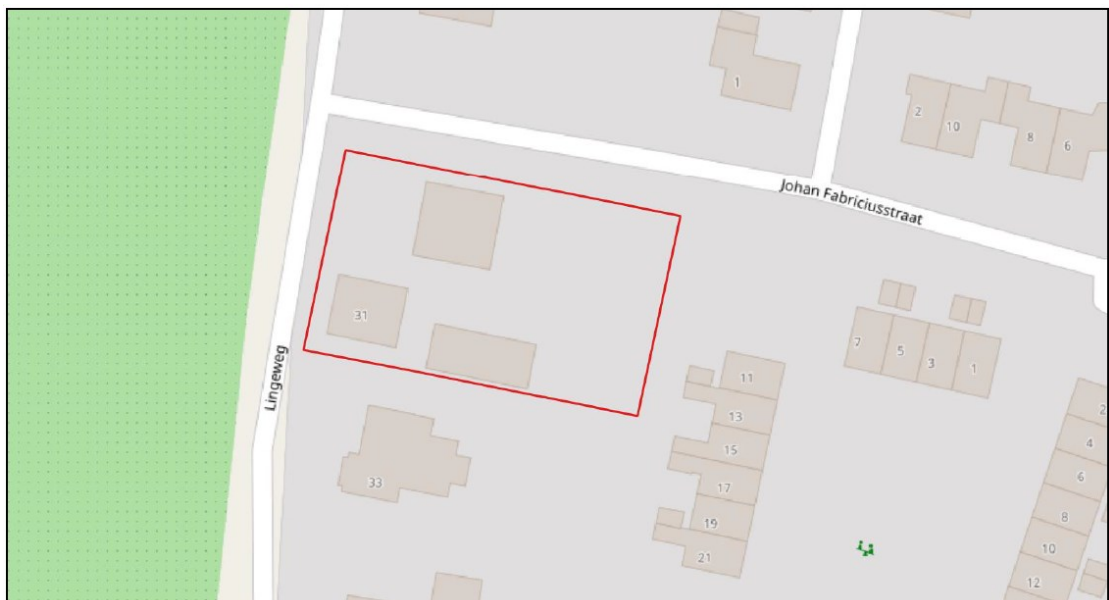
Figuur 2. Ligging en begrenzing projectgebied Lingeweg 31 te Tiel.