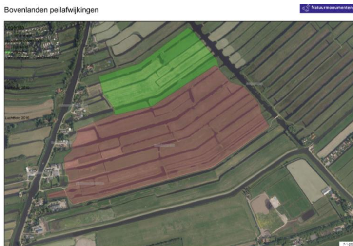
Figuur 1: Het plangebied. Het rode gebied is het zuidelijk deel, waar reeds een vergunning voor peilafwijking is afgegeven. Het groene deel is het middengebied.

Het noordelijk deel van de (Zuid-Hollandse) Bovenlanden wordt als natuur beheerd door een particulier, het zuidelijk deel is in 2012 ingericht door Natuurmonumenten. In 2019 zijn de resterende percelen in het middengebied verworven door Natuurmonumenten. Er ligt nu een kans om met deze recent verworven percelen de laatste ontbrekende schakel binnen dit gebied in te richten als natuur. Hierdoor ontstaat een robuuste natuurinrichting in de polder. De inrichting van de Bovenlanden als natuur kan hiermee worden voltooid.