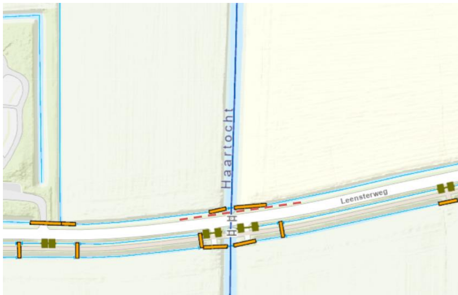
Figuur 3: Ingediende tekening 3, 1x kruising (gestuurde boring) hoofdwatgang, geen vaarweg.