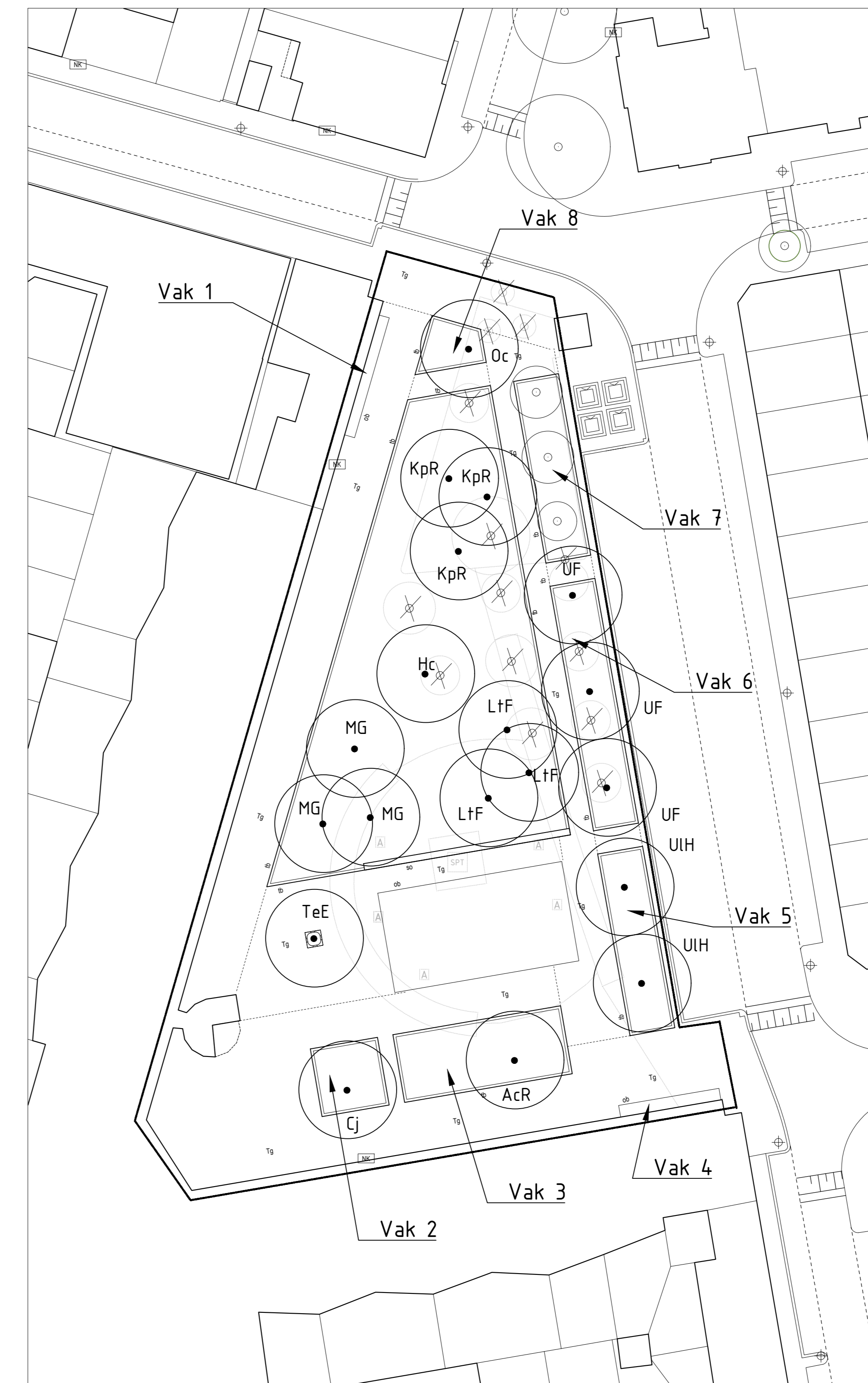
van Haeftenplein, schaal 1:250