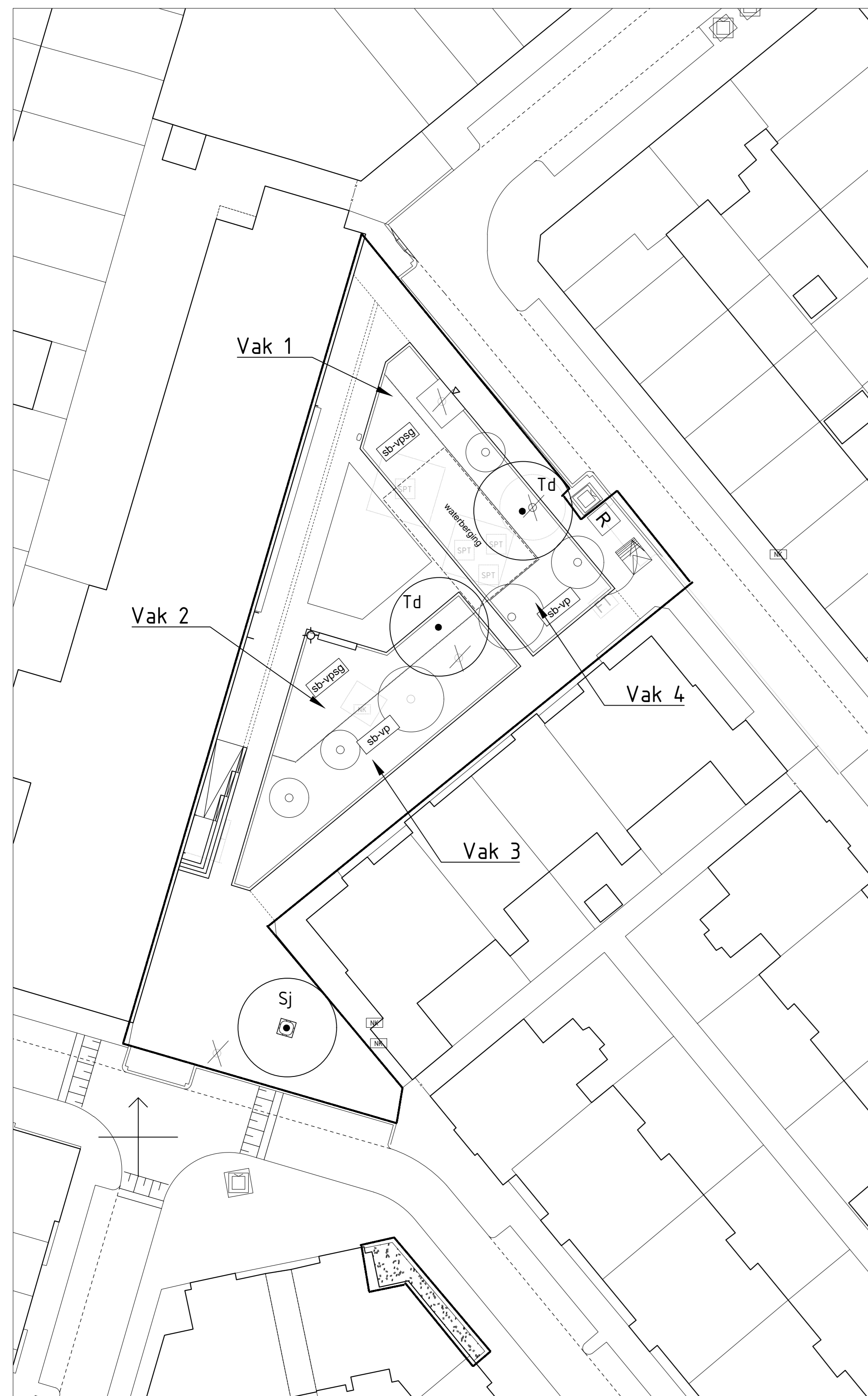
Walravenplein, schaal 1:250