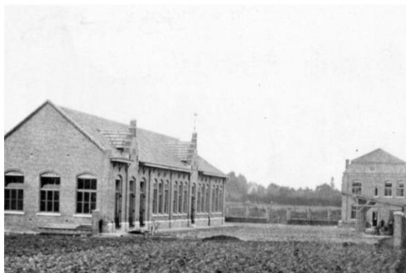
De school en onderwijzerswoning na de bouw in 1915.