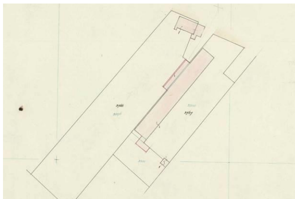
Kadastrale hulpkaart uit 1952