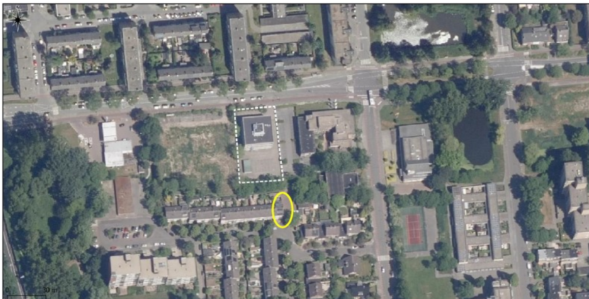
Figuur 2. Locatie van de aangebrachte tijdelijke voorzieningen voor Gewone dwergvleermuis. De kasten op de locatie Van Ketwich Verschuurlaan 157 staan niet op kaart weergegeven.

Om eventuele vertragingen in het proces voor te zijn, zijn op 21 maart 2022 preventief tijdelijke voorzieningen voor vleermuizen aangebracht in de directe omgeving. Op deze manier zijn er voor de huidige verblijfplaats 4 tijdelijke vleermuiskasten aangebracht en is aan de gewenningsperiode voldaan. In onderstaand figuur is de ophanglocatie van de tijdelijke kasten weergegeven. De kasten zijn op de zijgevel van Helene Swarthlaan 7 aangebracht en aan de Van Ketwich Verschuurlaan 157 (niet op kaart aangegeven). Het betreffen vleermuiskasten van het type VMT1, van Unitura en er is een kraamkast geplaatst op de locatie aan de Helene Swarthlaan 7.