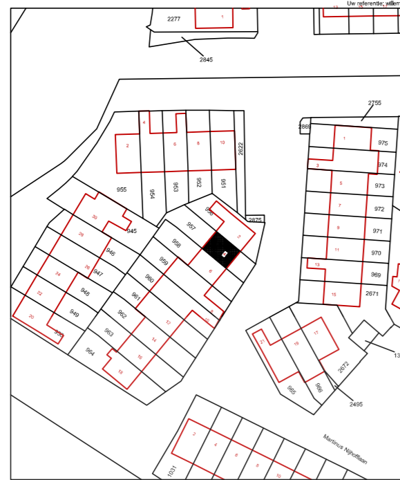
SITUATIE - KADASTRALE INFO Willem de Mérodelaan 4 Oegsteest Schaal 1:500