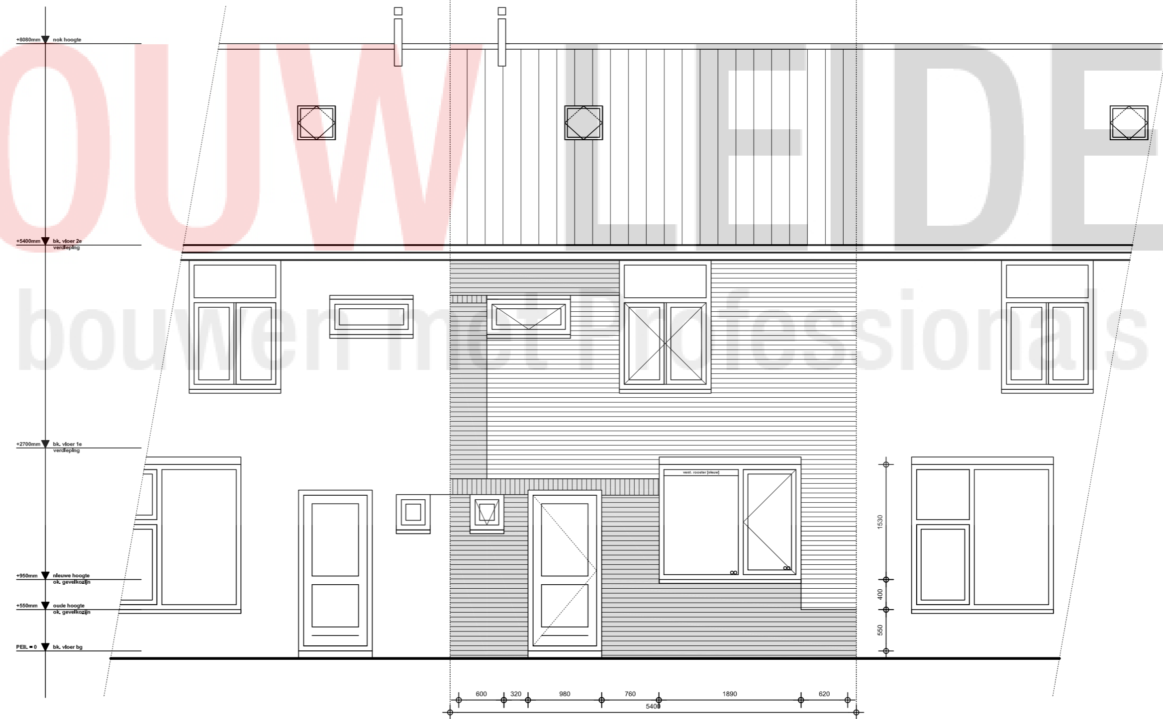
STRAATGEVEL [NIEUW] Willem de Mérodelaan 4 Oegsteest Schaal 1:50

Voorgeveltekening WdMlaan 4 uitgevoerd door ProBouw Leiden