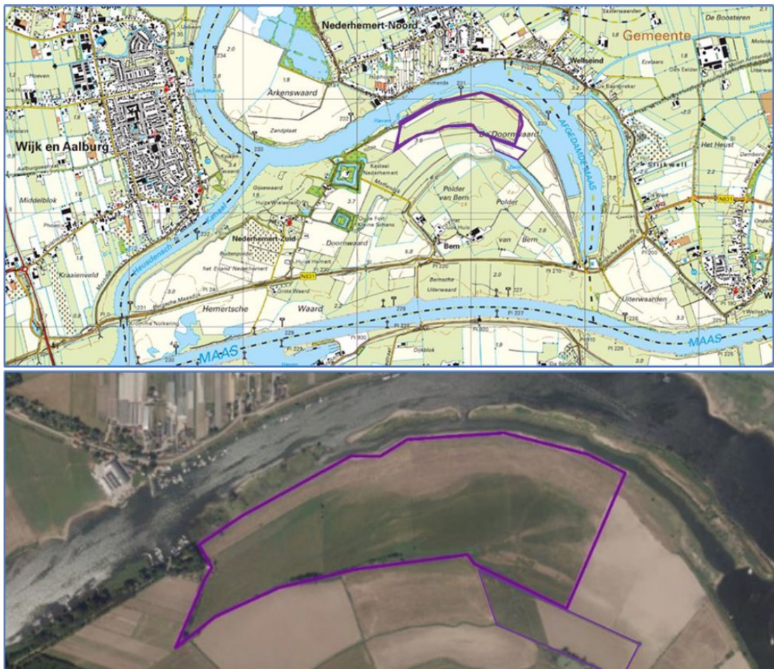
Figuur 1. Ligging en begrenzing projectgebied in de Doornwaard in de gemeente Zaltbommel.