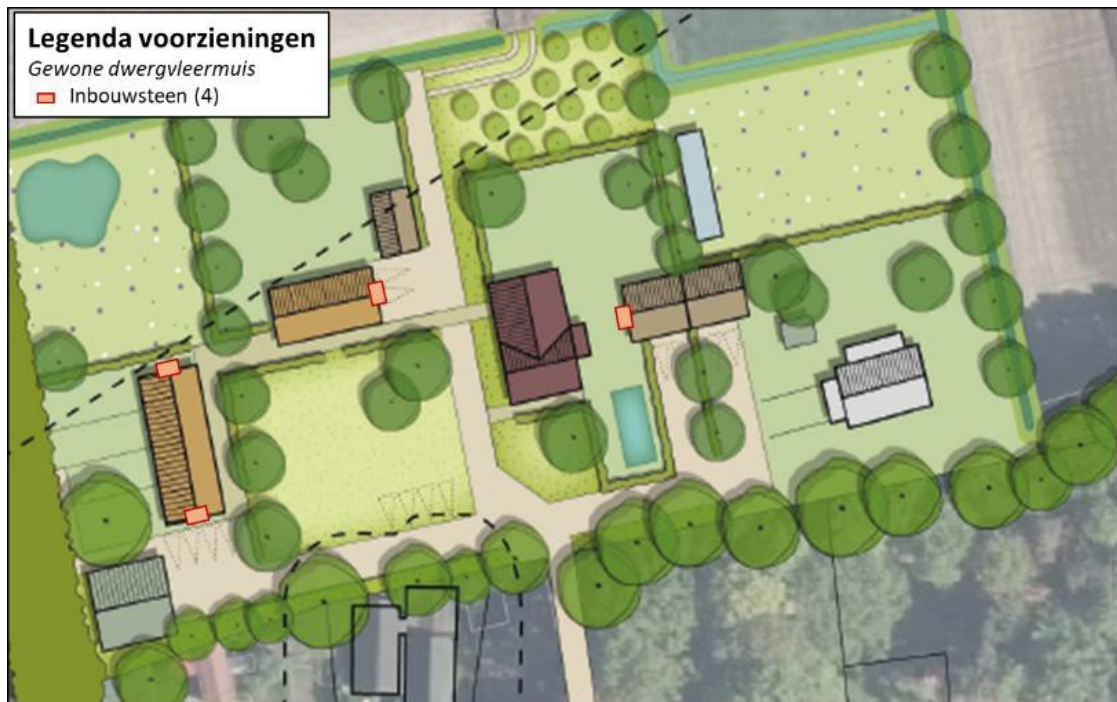
Figuur 5 Locaties van de permanente mitigerende maatregelen. Daarnaast zullen nog vier extra inmetseelkasten gerealiseerd worden (Blom Ecologie B.V., 2021).