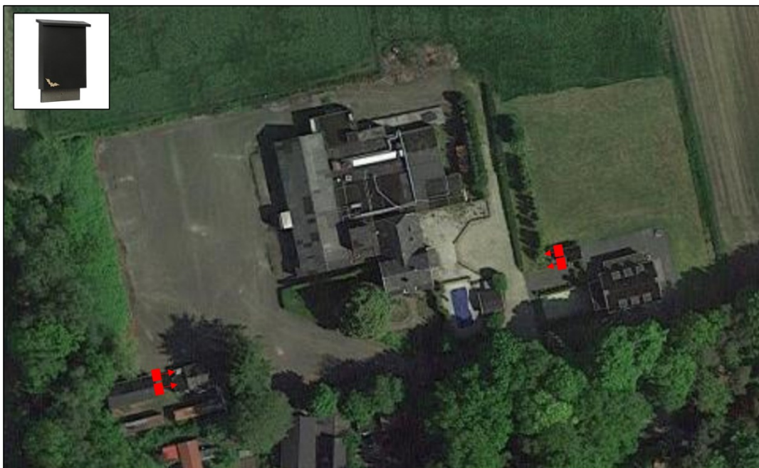
Figuur 4 Locaties van de extra tijdelijke mitigerende maatregelen (Blom Ecologie B.V., 2022).