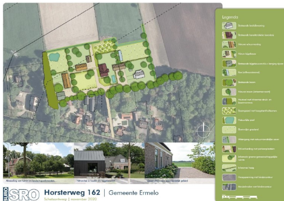
Figuur 2 Visuele representatie van de beoogde situatie (Buro SRO B.V., 2020).