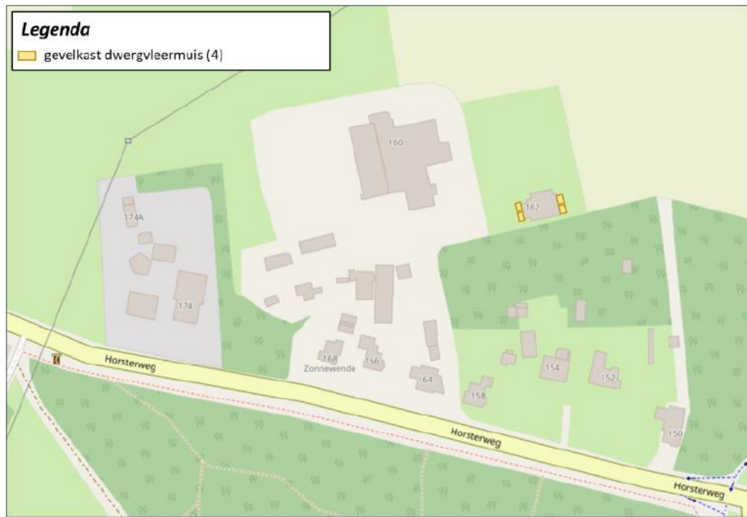
Figuur 3 Locaties van de tijdelijke mitigerende maatregelen (Blom Ecologie B.V., 2021).