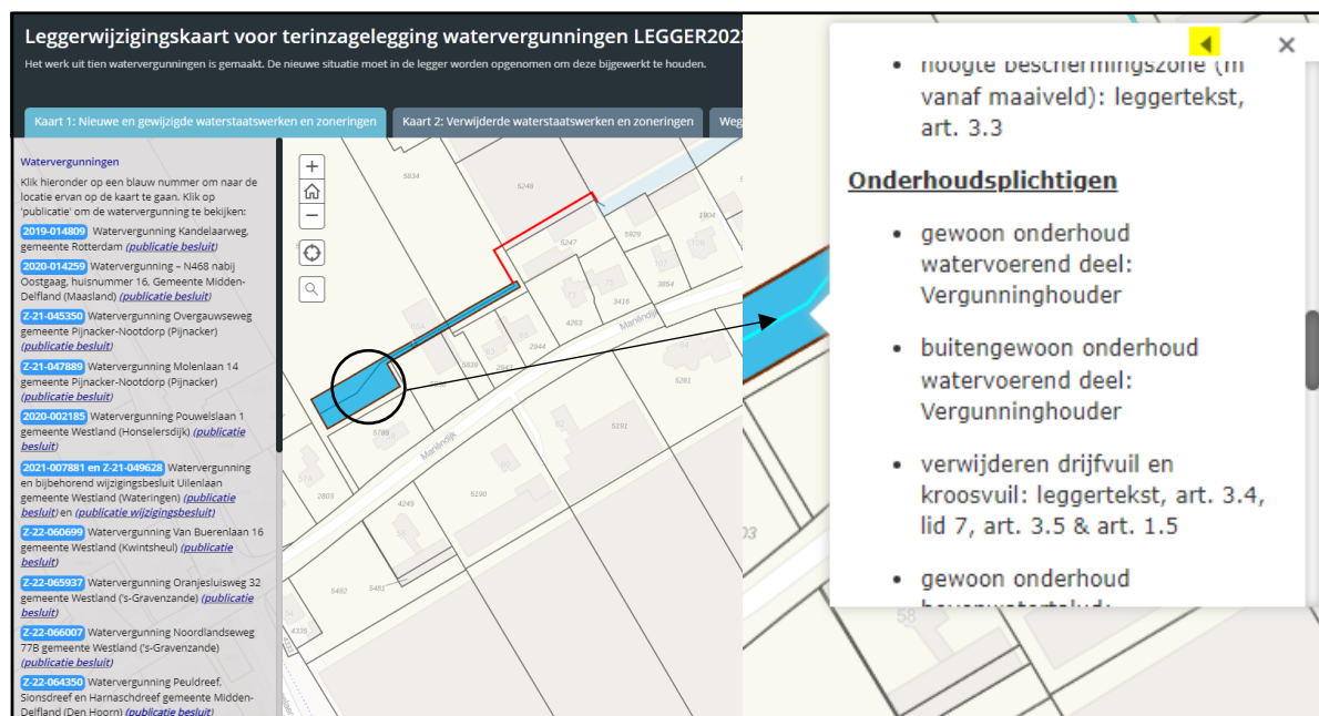
Figuur 1: Voorbeeld weergave van de interactieve leggerwijzigingskaart

Een voorbeeld van de werking van de leggerwijzigingskaart is weergegeven in Figuur 1.