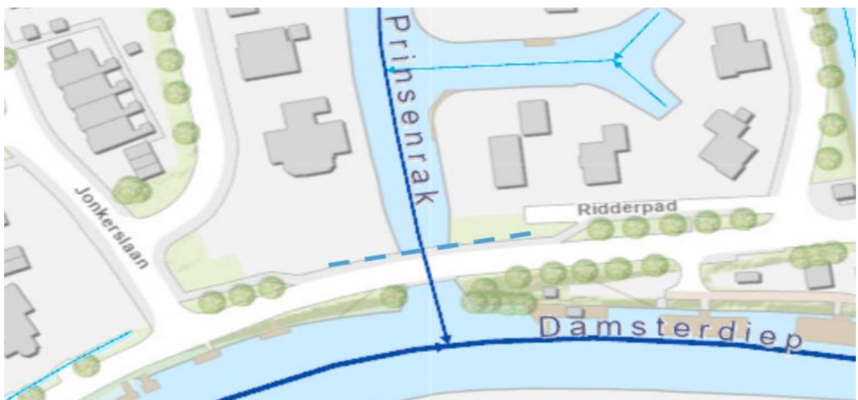
Figuur 2: Locatie gestuurde boring weergegeven met blauwe stippellijn.