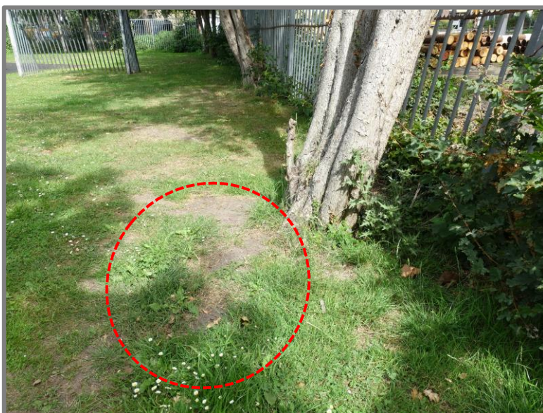
Fig. 1: De kleine boom is scheefgewaaid en hangt op het hekwerk van de speeltuin (links). De scheefstand komt door het kiepen van de wortelkluit die aan de trekkende zijde omhoog gekomen is (rechts). Indien de boom op ca. 0,5 meter hoogte wordt afgezaagd, dan zal hij vanuit de stobbe weer een nieuwe struik/boom vormen en is herplant niet noodzakelijk.