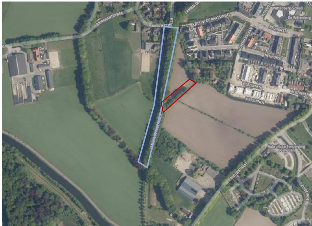
Figuur 1 Plangebied (blauw en rood omkaderd). In het blauwe kader wordt een deel van de begroeiing verwijderd voor de aanleg van de watergang met natuurvriendelijke oever. In het rode kader wordt een sloot gedempt.