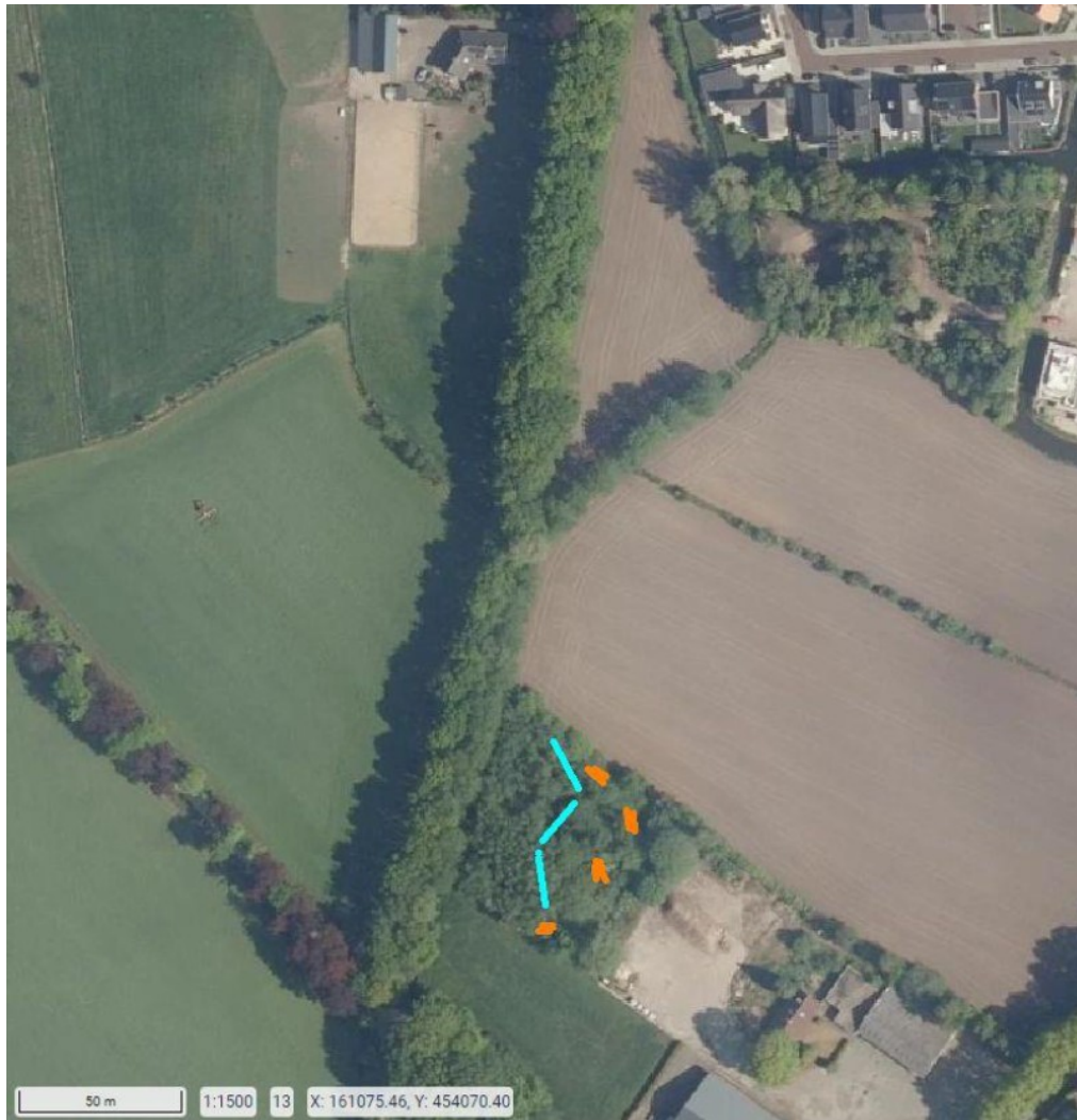
Figuur 3 Indicatieve locaties van de takkenhopen (oranje) en stobbewallen (blauw) voor de bunzing en de wezel.