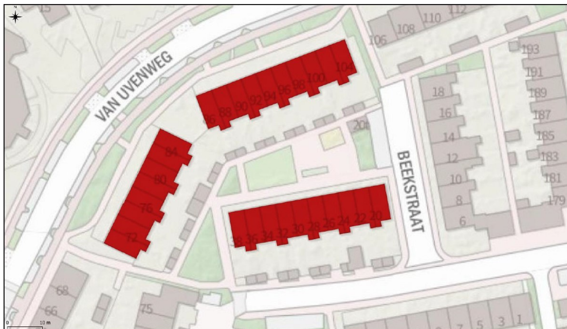
Figuur 1. Ligging en overzicht van de te renoveren woningen: Beekstraat 20-38 (even) en Van Uvenweg 70-104 (even).