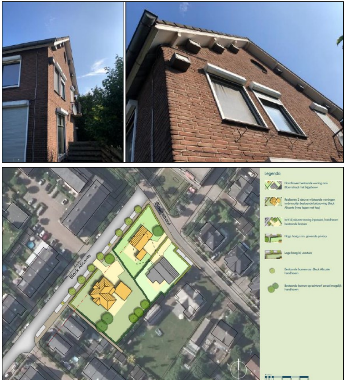
Figuur 2. De locaties van de 8 tijdelijke huismuskasten van het type NK MU 07 van Vivara Pro aan de gevel van de te behouden woning aan de Bloemstraat 2 te Huissen (afbeelding boven). Op de onderste afbeelding is een overzicht weergegeven van de nieuwe situatie met twee nieuwe woningen op de plek van de te slopen bijgebouwen, de te behouden woning (grijs ingetekend) en nieuw aan te planten hagen en te behouden bomen op het terrein.