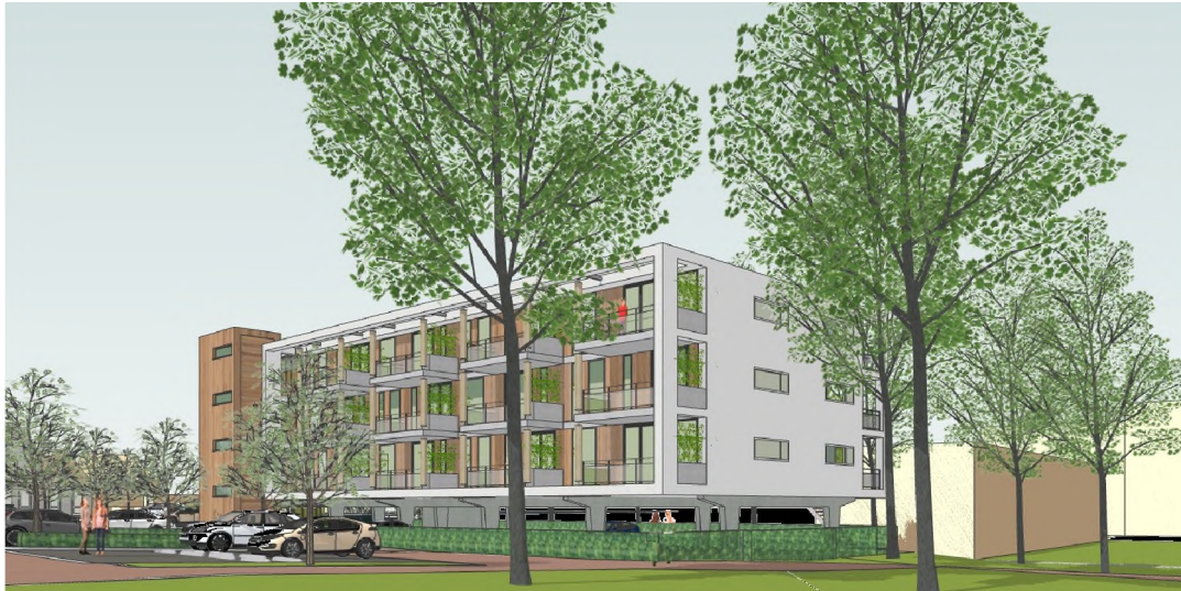
Artist impression appartementengebouw vanuit het toekomstig parkeerterrein