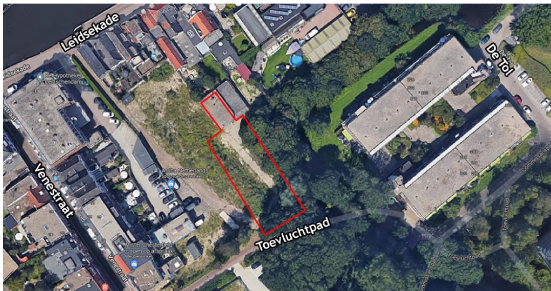
Luchtfoto locatie appartementengebouw

Het raadsbesluit Ontwerp verklaring van geen bedenkingen maakt integraal onderdeel uit van ons besluit.