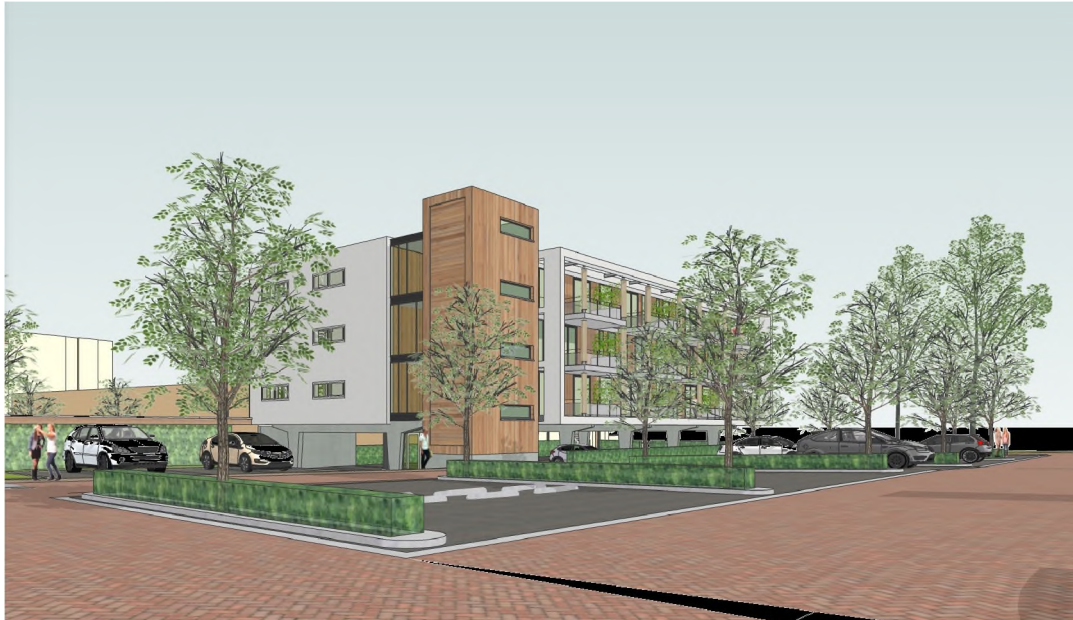
Artist impression appartementengebouw vanuit het toekomstig parkeerterrein