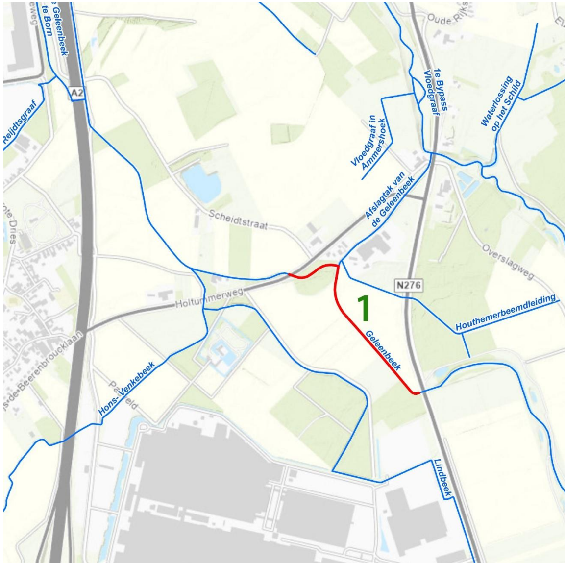
Figuur 1: plangebied herinrichting Geleenbeek