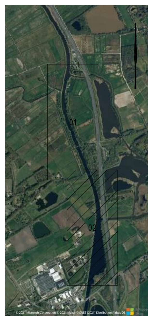
Overzicht SCHAAL 1 : 20.000